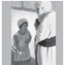
(ଅବଶିଷ୍ଟାଂଶ ୬ଷ୍ଠ ପୃଷ୍ଠାରେ)

“ଏରୂପେ, ସଦାପ୍ରଭୁଙ୍କ ସାକ୍ଷାତ୍ରେ ସେହି ଯୁବା ଲୋକଙ୍କର ପାପ ଅତି ଭାରୀ ହେଲା ...” ମାତ୍ର ବାଳକ ଶାମୁୟେଲ କ୍ରମେ କ୍ରମେ ବୃଦ୍ଧି ପାଇଲେ, ପୁଣି ସଦାପ୍ରଭୁଙ୍କର ଓ ମଧ୍ୟ ମନୁଷ୍ୟର ସାକ୍ଷାତ୍ରେ ଅନୁଗ୍ରହପାତ୍ର ହେଲେ” (୧ ଶାମୁୟେଲ ୨:୧୭,୨୬) ।