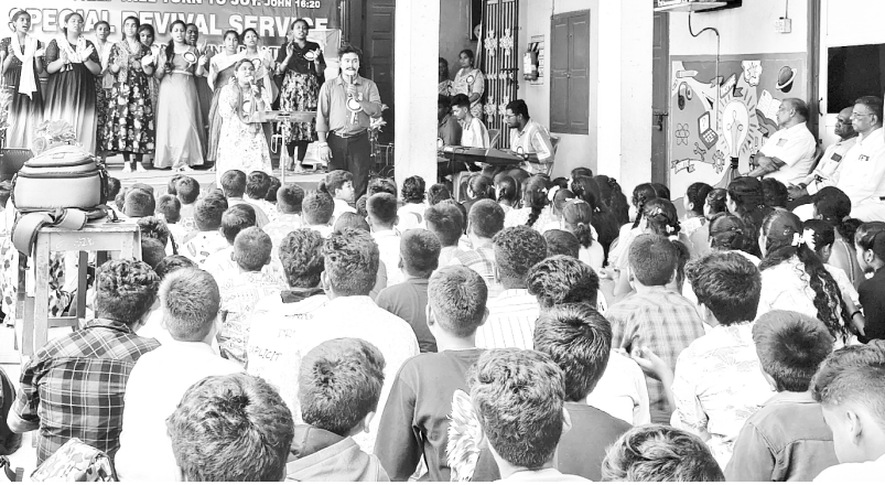
جوانوں کی جماعت

یہ کیمپ 20 جون سے 22 جون تک دونوں مقامات پر لگائے گئے۔ چپاک میں ہمارا مرکزی کلیسیا اور سنتوش پورم میں شاخ کلیسیا۔ خداوند نے فضل سے اپنی برکات کی بارش کی، اور ہم نے ایک بھرپور روحانی فصل دیکھی۔ آپ کی وفادار دعاؤں کا شکریہ!