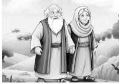
साराच्या हृदयात प्रथम विश्वासाची गर्भ धारणा होणे आवश्यक होते.

साराला इसहाकासाठी गर्भधारणा होण्यापूर्वी, तिच्या हृदयात विश्वासाची गर्भधारणा होणे आवश्यक होते. सारा मानवजातीसाठी देवाचे सर्वात मोठे वचन धारण करणार होती. हे घडण्यापूर्वी, देवाला तिच्यामध्ये एक कार्य करणे आवश्यक होते.