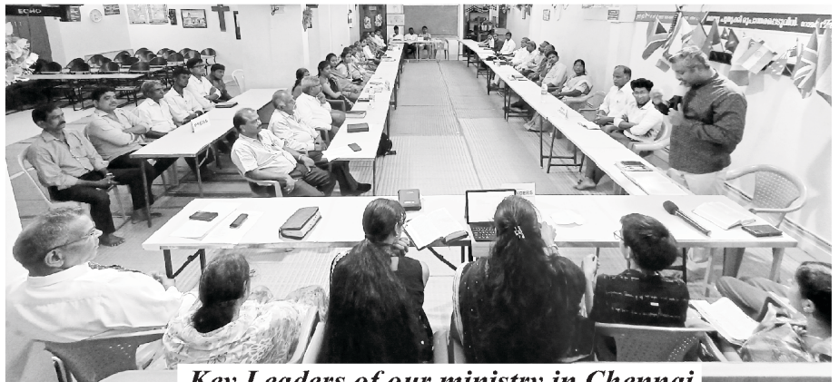
Key Leaders of our ministry in Chennai

Die feit dat daar stryery en gekibbel is, kan gewyt word aan die afwesigheid van gebed. 'n Mens wat nie bid nie, is die bron van een van twee dinge, nl. onenigheid of agteruitgang. Omdat Paulus baie goed die uitdagings en moeilikhede geken het wat sou kom uit kameraadskap, het hy 'n streng wet gemaak vir die kerk dat mens moet bid sonder ophou. Timoteus het die verantwoordelikheid