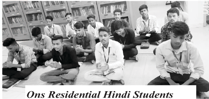
Ons Residential Hindi Students

Genade en vrede vir julle van God ons Vader. Ons Here God wat ons gedurende die jaar 2022 geseë het, sal ook met julle wees dwarsdeur die nuwe jaar 2023.