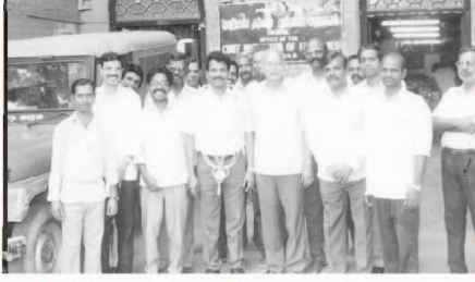
১৯৯৪ সালে সরকারী চাকরী ছাড়ার সময় আমার সহকর্মীদের সঙ্গে আমাদের কারখানার চীফ ইনস্পেকটর