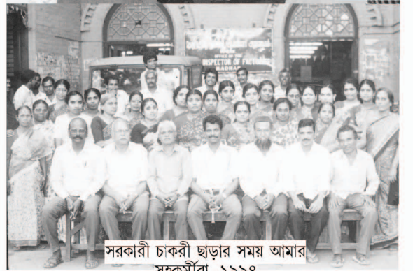
সরকারী চাকরী ছাড়ার সময় আমার সহকর্মীরা, ১৯৯৪

আমি চেম্বাইয়ে আনন্দের সঙ্গে এসেছিলাম এবং চাকরীতে যোগদান করেছিলাম। আমার বেতনের অধিকাংশটাই আমি আমার পরিচর্যা কাজে