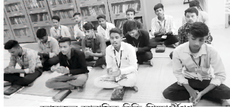
আমাদের আবাসিক হিন্দি শিক্ষার্থীগণ

আশা করি ঈশ্বরের অনুগ্রহে আপনারা ভালো আছেন। আমরা আমাদের অবিরত প্রার্থনায় এবং বিনতিতে আপনাদের তুলে ধরছি। আগামী দিনগুলিতে ঈশ্বর নিশ্চিতভাবে আপনার জীবনে মহান কার্যগুলি করবেন। আর