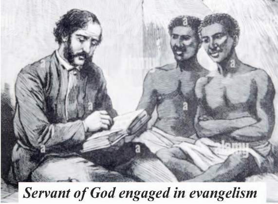
Servant of God engaged in evangelism

करना है। शैतान उन पर शारीरिक और आत्मिक दोनों तरह से आक्रमण कर रहा है। परमेश्वर के ऐसे सेवकों की सहायता करें जिन्हें आप जानते हैं, अपने धन और शारीरिक सहयोग से। परमेश्वर के बहुत से सेवक जो धनी हैं, अपनी बुलाहट और दूरदर्शिता को खो चुके हैं जो उनके पास शुरुआत में थी। वे अब अपनी सुख-सुविधाओं को बढ़ाने और संपत्तियां खरीदने में लगे हुए हैं। सेवकाई के नाम पर बड़े-बड़े भवनों का निर्माण करते हैं जिनकी वास्तव में आवश्यकता ही नहीं होती और इस प्रकार वे अपने मार्ग से विचलित हो जाते हैं। कृपया ऐसे लोगों का समर्थन करना बंद करें और उनका समर्थन करें जो वास्तव में परमेश्वर के लिए आत्माओं को जीतने के लिए कड़ी मेहनत करते हैं। परमेश्वर के ऐसे सेवकों को खोजें और उन्हें उनके प्रयासों में शामिल करें। परमेश्वर आपको आशीष दे।