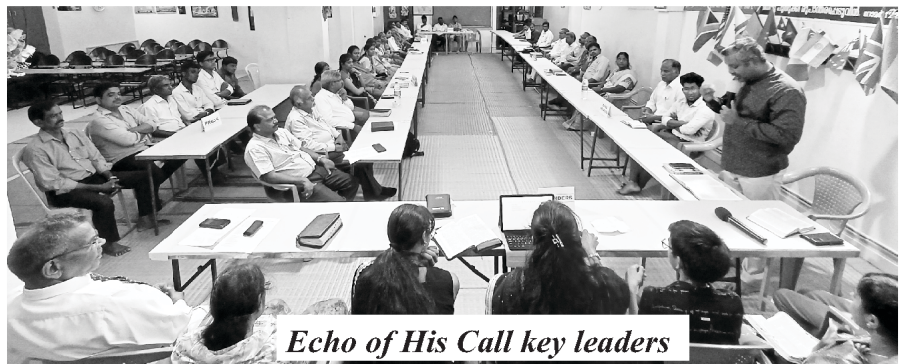
Echo of His Call key leaders

परमेश्वर के सेवक, जो लोगों को विनाश से बचाने और सही रास्ते पर ले जाने के लिए ईमानदारी से काम करते हैं, बहुत कष्ट उठा रहे हैं। हमें ऐसे लोगों की बुनियादी जरूरतों को पूरा