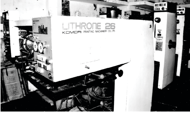
Present Automatic off-set Printing Machine

स्वचालित ऑफसेट प्रिंटिंग प्रेस दी है जिससे हम 96 भाषाओं में अपनी एको ऑफ हिज़ कॉल पत्रिकाएं छापते हैं। हम विभिन्न भाषाओं में कई आत्मिक पुस्तकें भी छापते हैं और परमेश्वर की कृपा से हम उन्हें मुफ्त में दुनिया भर में भेजते हैं!