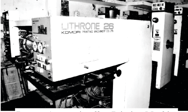
Present Automatic offset Printing Machine