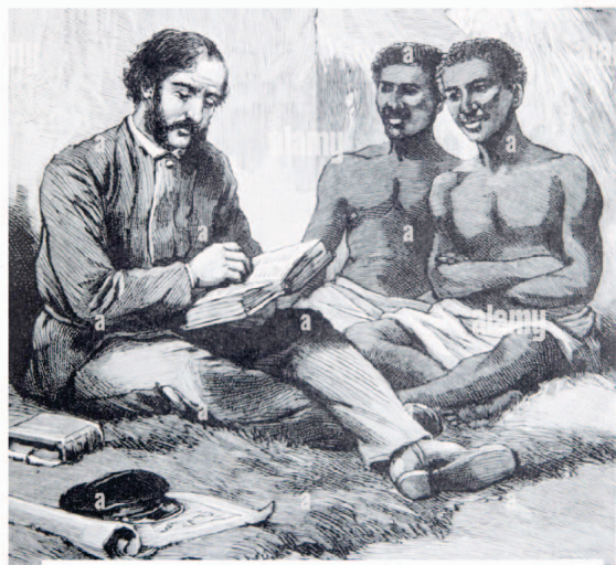
Servant of God engaged in evangelism

साथमा तपाईंले चिन्ने त्यस्ता परमेश्वरका सेवकहरूलाई सहायता गर्नुहोस् । धनी भएका धेरै परमेश्वरका सेवकहरूले सुरुमा आफूसँग भएको आफ्नो बोलावट र दर्शन गुमाएका छन् । अब तिनीहरू आफ्नो आरामदायी कुराहरू वृद्धि गर्न र सम्पत्ति किन्न संलग्न पनि भएका छन् । सेवकाइको नाउँमा तिनीहरूले ठूला भवनहरू निर्माण गरेका छन्, जुन वास्तविक आवश्यकता होइन र त्यसकारण तिनीहरू आफ्नो मार्गमा अलमलिरहेका छन् । कृपया यस्ता मानिसहरूलाई सहायता गर्न रोक्नुहोस् र परमेश्वरको निमित्त आत्मा जित्न साँचो रूपमा मेहेनेत गर्नेहरूलाई सहायता गर्नुहोस् । त्यस्ता परमेश्वरका सेवकहरू खोज्नुहोस् र तिनीहरूका प्रयासमा तिनीहरूसँग काँधमा काँध मिलाउनुहोस् । परमेश्वरले तपाईंलाई आशिष् दिनुहुनेछ ।