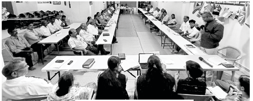
Echo of His Call key leaders

मानिसहरूलाई विनाशाबाट छुटकारा दिलाउन र सही मार्गमा तिनीहरूलाई डोयाउन इमानदारपूर्वक काम गर्ने परमेश्वरका सेवकहरू अत्यन्तै धेरै सताइएका छन् । हामीले यस्ता मानिसहरूको आधारभूत आवश्यकता पूरा गर्नुपर्दछ । दियाबलसले उहाँहरूलाई दुवै भौतिक र आत्मिक रूपमा आक्रमण गरिरहेको छ । तपाईंले आफ्नो पैसा र भौतिक सहायताको