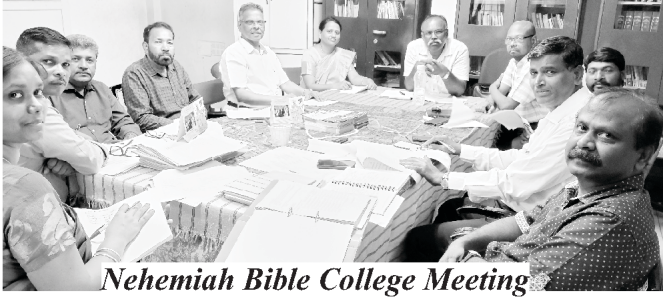
Nehemiah Bible College Meeting

4. ನಮ್ಮ ನೆಹಮೀಯ ಸತ್ಯವೇದ ಕಾಲೇಜ್ ಹಿಂದಿ ವಸತಿ ಮತ್ತು ತಮಿಳು ಸಾಯಂಕಾಲದ ಕೋರ್ಸ್‌ಗಳನ್ನು ನೀಡುತ್ತದೆ. ನಮಗೆ ಈ ಕಾಲೇಜ್‌ನಲ್ಲಿ ಒಳ್ಳೆಯ ಕಲಿಸುವ ಶಿಕ್ಷಕರು ಇದ್ದಾರೆ. ನಮಗೆ ಸರಿಯಾದ ದರ್ಶನವಿರುವ ದೇವರಿಗಾಗಿ ಸೇವೆ ಮಾಡುವ ವಿದ್ಯಾರ್ಥಿಗಳು ಬೇಕಾಗಿದ್ದಾರೆ. ಮುಂದಿನ ಶೈಕ್ಷಣಿಕ 2023-24 ವರ್ಷಕ್ಕೆ 5 ಜೂನ್‌ದಕ್ಕೆ ತರಗತಿಗಳು ಪ್ರಾರಂಭವಾಗುತ್ತವೆ. ಈಗ ಸುಮಾರು 30 ವಿದ್ಯಾರ್ಥಿಗಳು ಪದವಿಗಾಗಿ ಸಿದ್ಧರಾಗಿ ಮತ್ತು ಸೇವಾಕ್ಷೇತ್ರಕ್ಕೆ ಸೇವೆಮಾಡುವವರನ್ನು ತಯಾರು ಆಗಿದ್ದಾರೆ. ನೆಹಮೀಯ ಸತ್ಯವೇದ ಕಾಲೇಜ್ 23ನೇ ಸ್ನಾತಕೋತ್ತರವನ್ನು ಜೂನ್ 05, 23ರಂದು ಆಚರಿಸುತ್ತದೆ.