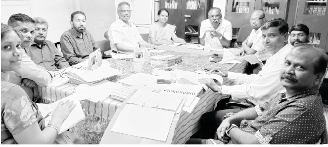
Nehemiah Bible College Meeting

४. हाम्रो नेहेम्याह बाइबल कलेजले दुवै हिन्दी (आवासीय कोर्स) र तामिल (साँभको कोर्स) भाषामा कोर्सहरू प्रदान गर्दछ। यो कलेजमा हामीसँग चेन्नाइमा पढाइरहनुभएका राम्रा शिक्षकहरू छन्। हामीलाई प्रभुको सेवा गर्ने उपयुक्त दर्शन भएका विद्यार्थीहरूको आवश्यकता छ। अर्को शैक्षिक सत्र २०२३-२०२४ को निम्ति कक्षाहरू जून ५, २०२३ बाट