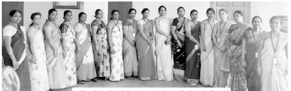
St. Paul's Matriculation School Staff

३. हाम्रो गाउँको हाई स्कूल सेन्ट पावलस् मेट्रिकसलेसन स्कूल राम्रो गतिमा संचालन भइरहेको छ । सिपालु र आत्मिक रूपमा परिपक्व शिक्षाविद्हरूका साथमा स्कूल संचालन भएको छ । हामीलाई असल विद्यार्थीहरू र शिक्षकहरूको आवश्यकता छ । कृपया यसको वृद्धि र स्कूलको निमित्त प्रार्थनामा सम्मिदिनुहोला ।