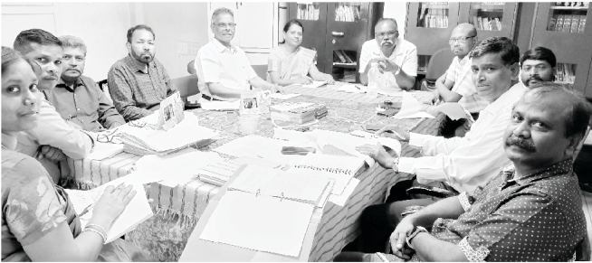
Nehemiah Bible College Meeting

୪. ଆମର ନିହିନିୟା ବାଲବଲ କଲେଜ ଉଇୟ ହିନ୍ଦୀ (ଆବାସିକ ପାଠ୍ୟକ୍ରମ) ଓ ତାମିଲ (ସାକ୍ଷ୍ୟ ପାଠ୍ୟକ୍ରମ) ଭାଷାରେ ପାଠ୍ୟକ୍ରମ ଯୋଗାଇଅଛି । ଆମ ନିକଟରେ ଏହି କଲେଜରେ ଶିକ୍ଷାଦାନ ପାଇଁ ଚେନାଇର ଅଧ୍ୟାପକମାନେ ଅଛନ୍ତି । ଆମେ ଏପରି ଛାତ୍ରମାନଙ୍କୁ ଆବଶ୍ୟକ କରୁ ଯେଉଁମାନେ ପ୍ରଭୁଙ୍କର ସେବା କରିବା ପାଇଁ ଏକ ଯଥାର୍ଥ ଦର୍ଶନ ରଖୁଥିବେ । ପରବର୍ତ୍ତୀ ଶିକ୍ଷା ବର୍ଷ ୨୦୨୩-୨୪ ପାଇଁ ୨୦୨୩ ଜୁନ ୫ ତାରିଖରୁ ପାଠ ପଢ଼ା ଆରମ୍ଭ ହେବ । ବର୍ତ୍ତମାନ ପ୍ରାୟ ୩୦ ଜଣ ଛାତ୍ର ସ୍ୱାତନ୍ତ୍ର ଉପାଧି ପାଇଁ ଓ ମିଶନ କ୍ଷେତ୍ରକୁ ଯିବା ପାଇଁ ପ୍ରସ୍ତୁତ ଅଛନ୍ତି ।