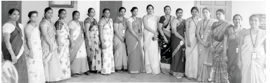
St. Paul's Matriculation School Staff

Our Ministries: ECHO OF HIS CALL Monthly Magazines (16 languages) BIBLECOR - Postal Courses (3 languages) Media Ministry Online Courses Theological Correspondence Courses (2 languages) Church Planting Nehemiah Bible Colleges Gospel Printing Press Great Commission Partners St. Paul's Matriculation School Crusades Community Development