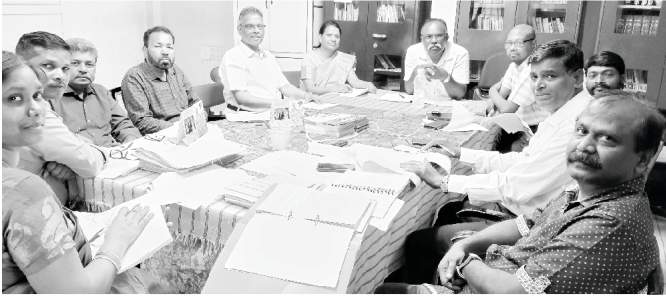
Nehemiah Bible College Meeting

(04). අපගේ නෙහෙමියා බයිබල් විදුහලෙහි හින්දි සහ දමිළ භාෂාවන්ගෙන් පාඩම් මාලාවන් පවත්වාගෙන යනු ලබයි. මෙහි නේවාසිකව හෝ සවස් කාලීන පාඩම් මාලාවන් වලට සහභාගිවීමට හැකිය. මෙම විදුහලෙහි චේන්නෙයි වල සිටින ඉතාම උසස් මට්ටමේ ගුරුවරුන් විසින් ඉගැන්වීම් කටයුතු සිදු කරනු ලබයි. අපට සේවය කිරීමට දෙවියන්වහන්සේගේ හස්තය අප හා සමඟ තිබෙන නිසා අපි දෙවියන්වහන්සේට ස්තූති කරමි.