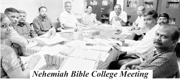
Nehemiah Bible College Meeting

ਪੜ੍ਹਾਉਂਦੇ ਹਨ। ਸਾਨੂੰ ਪ੍ਰਭੂ ਦੀ ਸੇਵਾ ਕਰਨ ਲਈ ਸਹੀ ਵਿਸ਼ਵੀ ਵਾਲੇ ਵਿਦਿਆਰਥੀਆਂ ਦੀ ਲੋੜ ਹੈ। ਅਗਲੇ ਅਕਾਦਮਿਕ ਸਾਲ 2023-2024 ਲਈ ਕਲਾਸਾਂ 5 ਜੂਨ 2023 ਤੋਂ ਸ਼ੁਰੂ ਹੋਣਗੀਆਂ। ਹੁਣ ਲਗਭਗ 30 ਵਿਦਿਆਰਥੀ ਗ੍ਰੈਜੂਏਸ਼ਨ ਅਤੇ ਮਿਸ਼ਨ ਖੇਤਰ ਵਿੱਚ ਜਾਣ ਲਈ ਤਿਆਰ ਹਨ।