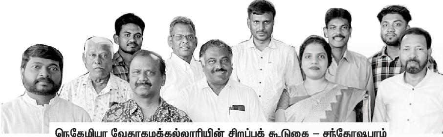
நெகேமியா வேதாகமக்கல்லூரியின் சிறப்புக் கூடுகை - சந்தோஷபுரம்

நமது சந்தோஷபுரம் ஊழிய வளாகத்தில் நெகேமியா வேதாகமக் கல்லூரியின் மூன்றாம் கல்லூரியை ஆரம்பிக்கவும், C.Th., Dip.Th. மற்றும் B.Th. போன்ற இறையியல் கல்விகளை நடத்தவும் ஜெபத்துடன் தீர்மானித்து, தொடர் நடவடிக்கைகளில் மும்முரமாக செயல்பட்டு வருகிறோம். இந்த நெருக்கடியும், கஷ்டமுமான சூழ்நிலையிலும் ஓர் புதிய ஊழியமா? என்றக் கேள்வி பொதுவாக தேவ மக்கள் உள்ளங்களில் எழுந்தாலும், தேவன் எங்களை இப்படியான புதியத் திட்டத்தை அமல்படுத்த உந்தித் தள்ளுகிறார் என்பதுதான் உண்மை. செய்யாமல் இருக்க முடியவில்லை. எல்லாம் தேவ சித்தப்படி நடக்கும்.