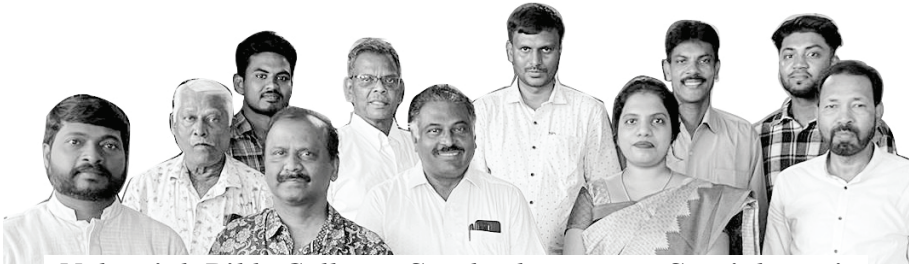
Nehemiah Bible College - Santhoshapuram – Special meeting

සඳහා C.th, Dip.Th, සහ BTH ආරම්භකර ඇත. ඔබට මෙතරම් කරදර හා ප්‍රශ්න තිබෙන විටදී මෙලෙස අලුත් දෙයක් පටන්ගත්තේ ඇයි? කියා ඔබ සමහර විටදී ඇසීමට හැකිය. නමුත් දෙවියන්වහන්සේ අපගේ හදවත් වලට අලුත් සැලසුමක් දෙන විටදී අපට නිහඬව සිටිය නොහැකිය. අප ක්‍රියාකළ යුතුයි. සෑම දෙයක්ම සිදුවන්නේ දේව කැමැත්ත නිසාය.