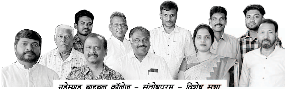
नहेम्याह बाइबल कॉलेज - संतोषपुरम - विशेष सभा

उस काम में सक्रिय रूप से शामिल हैं। परमेश्वर के लोग अपने दिलों में यह सवाल उठा सकते हैं : “जब सेवकाई में पहले से ही बहुत सारे संघर्ष और समस्याएं हैं तो एक नई सेवा क्यों शुरू करें?” यह सत्य है कि परमेश्वर एक नई योजना में उद्यम करने के लिए हमारे हृदयों में जोरदार दबाव डाल रहा है। इसलिए हम चुप नहीं रह सकते। सब कुछ प्रभु की इच्छा के अनुसार होगा।