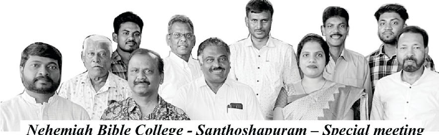
Nehemiah Bible College - Santhoshapuram – Special meeting

ನೆಹಮೀಯ ಸತ್ಯವೇದ ಕಾಲೇಜಿನ ಎಲ್ಲಾ ಚಟುವಟಿಕೆಗಳು ಬಹಳ ವೇಗವಾಗಿ ಬೆಳೆಯುತ್ತಾ ಇವೆ. ಅಂಚೆಯ ಮೂಲಕ ಸತ್ಯವೇದ ಕೋರ್ಸ್‌ಗಳನ್ನು ಪ್ರಾರಂಭಿಸುವುದಕ್ಕೆ ಕರ್ತನು ನಮಗೆ ಸಹಾಯಮಾಡಿದನು ಮತ್ತು ದೈವಶಾಸ್ತ್ರದ ದೂರಶಿಕ್ಷಣ ಕೋರ್ಸ್‌ಗಳು. ಈಗ ನಾವು ಹೊಸ ಕೋರ್ಸ್‌ಗಳನ್ನು ಚಾಲನೆ ಮಾಡುವುದಕ್ಕೆ ಸಹಾಯವಾಗಿರುತ್ತದೆ. (ಸಾಯಂಕಾಲ ಮತ್ತು ವಸತಿ). ನಮ್ಮ ನೆಹಮೀಯ ಸತ್ಯವೇದ ಕಾಲೇಜುಗಳ ವಿಶೇಷ ಅತಿಥಿಗಳು ಮತ್ತು ದೈವಶಾಸ್ತ್ರದ ವಿದ್ವಾಂಸರ ಸಭೆಯು ಜೂನ್ 04ರಂದು ಸಂತೋಷ ಪುರಂನಲ್ಲಿರುವ ನಮ್ಮ ಸೇವೆಯ ಕ್ಯಾಂಪಸ್‌ನಲ್ಲಿ ಸಂತೋಷ ಪುರಂನಲ್ಲಿ ಸತ್ಯವೇದ ಕಾಲೇಜನ್ನು ಪುನರಾಂಭಿಸುವ ಬಗ್ಗೆ ನಡೆಯಿತು.