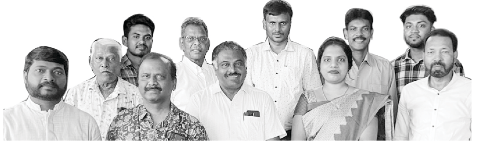
نخمیاہ بائبل کالج، سنتوشہ پورم - خاص جماعت

ہمارے سنتوشہ پورم کیمپس میں تیسرا نخمیاہ بائبل کالج شروع کرنے اور سی۔ ٹی ایچ اور بی۔ ٹی ایچ پیش کرنے کا بھی دعائیہ طور پر فیصلہ کیا گیا۔ اور اور اس لیے ہم اس کام میں بڑھ چڑھ کر حصہ لیتے ہیں۔ خدا کے لوگ اپنے دلوں میں ایک سوال اٹھا سکتے ہیں: "جب خدمت میں جیلے سے ہی بہت ساری جدوجہد اور پریشانیوں ہیں تو ایک نئی خدمت کیوں شروع کی جائے؟" یہ سچ ہے کہ خدا ہمارے دلوں پر ایک نئی منصوبہ بندی کرنے کے لیے سخت دباؤ ڈال رہا ہے۔ اس لیے ہم خاموش نہیں رہ سکتے۔ سب کچھ خدا کی مرضی کے مطابق ہوگا۔ ہماری ایک ہی زندگی ہے اور وہ بھی جلد ہی مر جاتی ہے!! یہ میری دلی خواہش ہے کہ ہمارے خداوند یسوع مسیح کے لیے ہر ممکن کوشش کروں۔