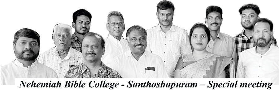
Nehemiah Bible College - Santhoshapuram – Special meeting

सान्थोसापुरममा बाइबल कलेज पुनः सुरु गर्ने सन्दर्भमा हाम्रो नहेम्याह बाइबल कलेजहरूका ईश्वरशास्त्रीय विद्वानहरू र विशेष पाहुनाहरूको बैठक सान्थोसापुरममा भएको हाम्रो सेवकाइको प्राङ्गणमा जून ४ मा भएको थियो ।