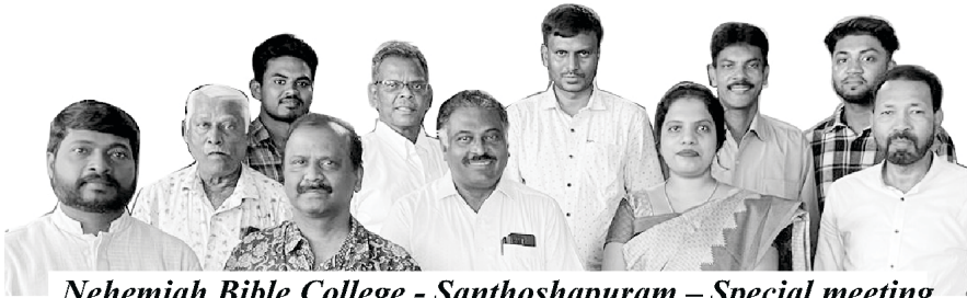
Nehemiah Bible College - Santhoshapuram – Special meeting

Dip.Th., ਅਤੇ B.Th ਦੀ ਪੇਸ਼ਕਸ਼ ਕਰਨ ਦਾ ਵੀ ਪ੍ਰਾਰਥਨਾਪੂਰਵਕ ਫੈਸਲਾ ਕੀਤਾ ਗਿਆ ਅਤੇ ਅਸੀਂ ਉਸ ਕੰਮ ਵਿੱਚ ਸਰਗਰਮੀ ਨਾਲ ਸ਼ਾਮਲ ਹਾਂ। ਪ੍ਰਮੇਸ਼ਵਰ ਦੇ ਲੋਕ ਸ਼ਾਇਦ ਆਪਣੇ ਦਿਲਾਂ ਵਿੱਚ ਇਹ ਸਵਾਲ ਉਠਾਉਣ: “ਜਦੋਂ ਸੇਵਕਾਈ ਵਿੱਚ ਪਹਿਲਾਂ ਹੀ ਬਹੁਤ ਸੰਘਰਸ਼ ਅਤੇ ਸਮੱਸਿਆਵਾਂ ਹਨ, ਤਾਂ ਨਵੀਂ ਸੇਵਕਾਈ ਕਿਉਂ ਸ਼ੁਰੂ ਕੀਤੀ ਜਾਵੇ?” ਇਹ ਸੱਚ ਹੈ ਕਿ ਪ੍ਰਮੇਸ਼ਵਰ ਸਾਡੇ ਦਿਲਾਂ ਵਿੱਚ ਨਵੀਂ ਯੋਜਨਾ ਬਣਾਉਣ ਲਈ ਜ਼ੋਰ ਪਾ ਰਿਹਾ ਹੈ। ਇਸ ਲਈ ਅਸੀਂ ਚੁੱਪ ਨਹੀਂ ਰਹਿ ਸਕਦੇ। ਸਭ ਕੁਝ ਪ੍ਰਭੂ ਦੀ ਰਜ਼ਾ ਅਨੁਸਾਰ ਹੀ ਹੋਵੇਗਾ।