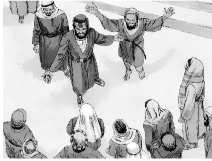
Healing in the name of Jesus Christ!

मसीहियों के लिए यह महत्वपूर्ण है कि वे अपने विश्वास के मार्ग पर अपने आप को अलग-थलग न करें। हालांकि परमेश्वर के साथ अकेले समय बिताना अच्छा है, लेकिन दूसरों पर