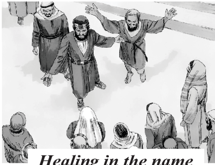
Healing in the name of Jesus Christ!