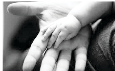
என் விரல்களை யுத்தத்திற்கு படிப்பிக்கிற கர்த்தர்

இந்த உன்னத போராட்டத்தை எப்படி போராடுவது? இது விசுவாசத்தினால் மாத்திரமே சாத்தியமாகும். இந்த நீதியான போராட்டத்தை விசுவாசமில்லாமல் போராட முடியாது; போராடாமல் நித்திய ஜீவனைச் சுதந்தரிக்க முடியாது. நித்திய ஜீவனைக் குறித்த எண்ணம் இல்லையெனில் நாம் இங்கே வாழ்வதற்கு எந்த நோக்கமுமே இல்லை. என் கைகளைப் போருக்கும் என் விரல்களை யுத்தத்திற்கும் படிப்பிக்கிற என் கண்மலையாகிய கர்த்தருக்கு ஸ்தோத்திரம் என்று வேதம் சங்கீதம் 144:1 இல் அழகாகக் குறிப்பிட்டுள்ளது. தேவனே நமது பயிற்சியாளரும், பரலோக சேனையின்