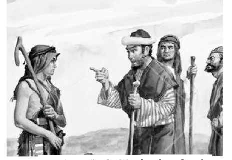
தாவீதை கேள்விகேட்கும் எலியாப்

சில அநாவசியமான சூழ்நிலைகளிலிருந்து விலகிச் செல்லும் ஞானத்தை தேவன் நமக்குத் தந்தருள்வாராக. எனதருமை நண்பர்களே! ஒரு மிகப்பெரிய நோக்கத்திற்காக நீங்கள் அழைக்கப்பட்டிருக்கிறீர்கள். எதைச் செய்ய நீங்கள் அழைக்கப்பட்டீர்களோ, அதைச் செய்ய விடாமல் தடுக்க 'எலியாபின் வார்த்தைகள்' உங்களைத் தடுத்துவிடக் கூடாது. "எலியாபுக்களை" எதிர்த்து போராடுவதை விட்டு விட்டு, "கோலியாத்துகளை" எதிர்த்து போராடுவதில் நாம் கவனம் செலுத்த வேண்டும். நமது ஆண்டவருக்காக வாழ முக்கியமான தீர்மானங்களை எடுக்கும் போது தடைகளையும், எதிர்ப்புகளையும் சந்திக்க நேரிடுவது சகஜம்தான். இந்த தடைகள் எலியாபைப் போன்ற மக்கள் வடிவத்தில் வரலாம். அத்தகைய மக்களின் குற்றச்சாட்டுகளையும், எதிர்மறையான வாக்குகளையும் நாம் ஏற்றுக்கொண்டால், கர்த்தருக்காக நமக்கிருக்கும் உற்சாகம், அர்ப்பணம், வைராக்கியம் ஆகியவைகள் அணைந்துவிடும்.