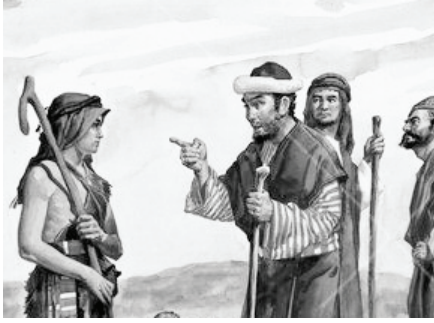
Eliab asked questions to David

මෙම සියලුම ප්‍රශ්න වලට පිළිතුරු දීමට දාවිත්ට අවස්ථාවක් තිබුණි. එසේ වුවා නම් ඔහු ගොලියන් සමඟ සටන් කිරීමට නොගොස් එලියාබ් සමඟ සටනට යාමට සිදුවෙනු ඇත. දෙවියන්වහන්සේ ඔබව ගොලියන් සමඟ සටන් කිරීමට කැඳවා තිබේ නම් ඔබගේ කාලය එලියාබ් සමඟ නාස්ති නොකරන්න. යුද්ධය එලියාබ් සමඟ නොව ගොලියන් සමඟයි. ඔබගේ කාලය නාස්ති නොකර ඔබ යුද්ධ භූමිය වෙත පියවර තබන්න.