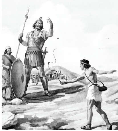
David fought with Goliath

ළිය සහෝදරයා සහෝදරිය, දාවිත්ව සටන් බිමට ගෙන ඒමට දෙවියන්වහන්සේට අනර්ඝවූ සැලැස්මක් තිබුණි. දාවිත්ට සටන් බිමේ සිටි තම සහෝදරයාට කෑම ගෙනවිත් දීමට අවශ්‍යයි කියා සිතූ නමුත් දෙවියන්වහන්සේට ඔහු ගැන සැලසුම වූයේ වෙනස් වූ ආකාර දෙයකි. දාවිත්ව ඉශ්‍රායෙල්හි රජෙක් ලෙස පත් කිරීමේ පළමු පියවර වූයේ මෙම සටනයි. එම අවස්ථාවේදී දාවිත් මේ ගැන දැන සිටියේ නැත. දාවිත් කෙරෙහි දෙවියන්වහන්සේගේ අනර්ඝවූ සැලැස්මක් හා ඔහුට දෙවියන්වහන්සේගේ ආශීර්වාදයන් තිබුණි. නමුත් සටන නැමති අභියෝගයට මුහුණ දීමට දාවිත්ට සිදුවිය. අපට පැමිණෙන්නාවූ සටන් අපව විනාශ කරනවාය කියා අප සිතුවත් අපගේ සටන් හා අභියෝග තුළ දෙවියන්වහන්සේගේ යහපත්කම සැඟවී තිබේ. මන්ද ඉදිරි සැඟවී තිබෙන ආශීර්වාද වලට පියවරක් ලෙස අපගේ සටන් ක්‍රියා කරයි.