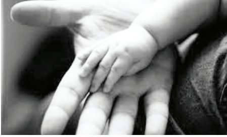
God trains my fingers for battle

මෙම සටන අප සටන්කරන්නේ කෙසේද? එනම්, මෙම සටන අපට ජයගත හැක්කේ ඇදහිල්ල කරණකොට පමණි. ඇදහිල්ල නොමැතිව මෙම ධර්මශ්ඨකමේ සටන ජය ගැනීමට බැරිය. අපට සදාකාල ජීවනයද උරුමකර ගැනීමටද නොහැකිය. භීතාවලිය 144:1 හි ඉතා අලංකාර දෙයක් සඳහන් කරයි. “යුද්ධයට මාගේ අත්ද සටනට මාගේ ඇඟිලිද පුරුදු කරන්නාවූ මාගේ පර්වතය වූ ස්වාමීන්ට ප්‍රශංසා වේවා.” අපව යුද්ධයට පුහුණු කරනු ලබන්නේ ස්වාමීන්වහන්සේමය.