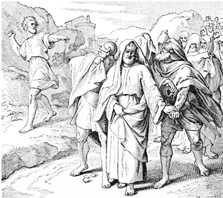
Shimei cursed David

1 සාමුවෙල් 16 වන පරිච්ඡේදය දෙස බලන විටදී පරිනතවූ වැඩිමහල්ලෙක් වූ දාවිත්ව අපට දැකීමට හැකිය. ඔහු දැන් තම පුත්‍රවූ අබ්සලෝම් කෙරෙහි පලා යමින් සිටී. මන්ද දාවිත්ගේ මෙම පුත්‍රයා ඔහුගේ රාජධානිය ඔහුගෙන් උදුරා ගත්තේය. දාවිත් තමාගේ මහලු කාලයේදී නිවාඩු ගත කිරීමට අවශ්‍යව සිටි විටදී ඔහුගේ ජීවිතය බේරා ගැනීම පිණිස ඔහු දුවමින් සිටී. මේ මොහොතේදී දාවිත් ශාරීරිකව හා මානසිකව මහත් පීඩනයකට පත්ව සිටියේය. ඔහු පලායන වේලාවේදී