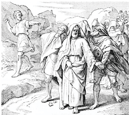
Shimei cursed David

ఎప్పుడు తొలగిపోవాలో మరియు ఎప్పుడు గురియొద్దకు పరుగెత్తాలో మనము నేర్చుకోవాలి అవసరము ఉన్నది. 48వ వచనములో, గొల్కాతుకు వ్యతిరేకముగా పోరాడుటకు యుద్ధరంగము వైపునకు దావీదు పరుగెత్తడమును మనము చూస్తాము. ప్రతి ఒక్కరు గొల్కాతునుండి దూరముగా పరుగెత్తుచున్నప్పుడు, దావీదు అతని యొద్దకు పరుగెత్తాడు. మీ యుద్ధములను ఎన్నుకొనుటకు నేర్చుకొనుము. నిరుత్సాహపరచే, నిందించే, అబద్ధపు, అవమానపరచే మాటలను పట్టించుకోవద్దు మరియు మీ పిలుపుపై కేంద్రీకరించుము మరియు దానివైపునకు పరుగెత్తుము. విడిచిపెట్టవద్దు!