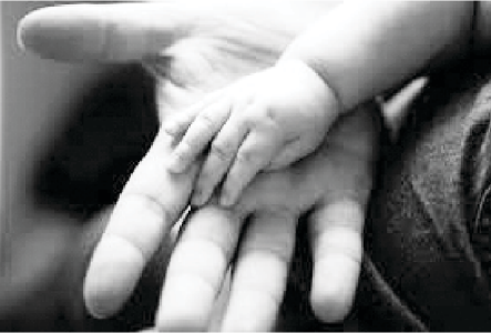
God trains my fingers for battle

ఏది ఏమైనా, అన్ని యుద్ధముల విషయమై పోరాడవలసిన అవసరము లేదని మనము గ్రహించాలి. కొన్ని యుద్ధములు లేక సవాళ్లు ప్రాముఖ్యమైన యుద్ధమునుండి మనలను దారి తప్పించుటకు వస్తాయి. జ్ఞానముతో ఏ యుద్ధములు చేయాలో ఎన్నుకొనుటకు నేర్చుకోవాల్సిన అవసరత మనకు ఉన్నది.