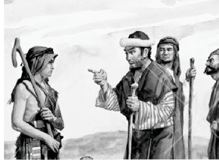
एलियाब ने दाऊद से सवाल पूछता है

हमारा उत्साह, समर्पण और जोश खत्म हो सकता है।