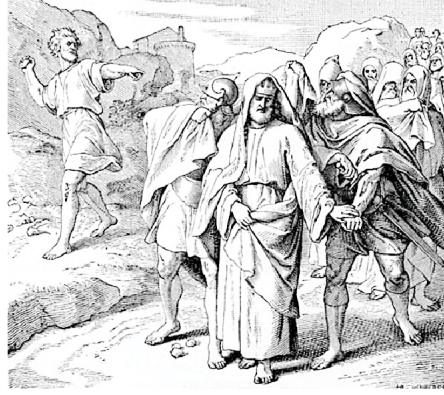
Shimei cursed David

२ शमूएल १६ अध्यायमा हामीले बुढो, परिपक्व, थकित दाऊदलाई देख्छौं। अब तिनी आफ्नो छोरा अब्शालोमवाट भागिरहेका छन्, जसले तिनको राज्यलाई लिएका थिए। जब तिनी आराम गर्न सक्ने, रमाइलो गर्न सक्ने र आफ्ना सन्तानमाथि भर पर्न सक्ने भनेर विचार गरेको समयमा तिनी आफ्नो जीवन बचाउनको निम्ति भाग्नुपरेको थियो ! दाऊद शारीरिक, मानसिक र भावनात्मक रूपमा थकित भएका थिए। यो समयमा तिनले शाऊलको परिवारको सदस्य शिमीलाई भेट्छन्, जसले दाऊदमाथि नराम्रा शब्द प्रयोग गर्छन् र तिनलाई सराफ्छन्।