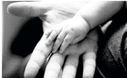
God trains my fingers for battle

हामीले कसरी यो नैतिक लडाइँलाई लड्न सक्छौं ? यो पूर्णरूपमा विश्वासद्वारा हुन्छ । विश्वासविना हामी यो धार्मिक लडाइँ लड्न असमर्थ छौं र यसविना हामीले अनन्त जीवन सुरक्षित गर्न सक्दैनौं । यसको अर्थचाहिँ हामीले आफ्नो अस्तित्वको उद्देश्यलाई गमाइरहेका हुन्छौं । भजनसंग्रह १४४:१ ले सुन्दर तरिकाले बताउँछ, मेरो चट्टान, परमप्रभुको प्रशंसा होस्, जसले मेरो हातलाई युद्ध गर्न र मेरा औंलाहरूलाई लडाइँ गर्न सिकाउनुहुन्छ । युद्धको निम्ति हामीलाई तयार गरिरहनुहुने