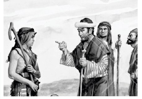
Eliab asked questions to David

दाऊदले यी सबै आरोपहरूका प्रश्नहरूलाई जवाफ दिन सुरु गरेका भए तिनले गोल्थतसँग लड्नुको साटो एलीआबसँग लडाइँ गर्थे । रणभूमिमा आउनु तिनको उद्देश्य पूरा हुने थिएन । जब परमेश्वरले तपाईँलाई गोल्थतसँग लडाइँ गर्न बोलाउनुहुन्छ, एलीआबसँग आफ्नो समय खेर नफाल्नुहोस् । तपाईँका लडाइँहरू बुद्धिमानीपूर्वक छान्नुहोस् । तपाईँको लडाइँ संसारका एलीआबसँग होइन तर “गोल्थतसँग” हो । निस्कन सिक्नुहोस् !!