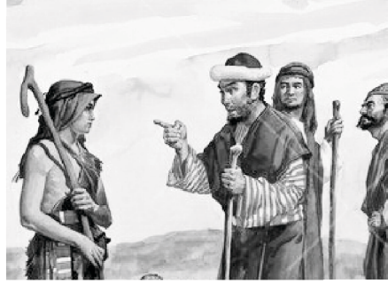
ଇଲୀୟାବ ଦାଉଦଙ୍କୁ ପ୍ରଶ୍ନ କରୁଛନ୍ତି ।

ଯଦି ଦାଉଦ ଏହି ସମସ୍ତ ଅଭିଯୋଗର ଉତ୍ତର ଦେବା ଆରମ୍ଭ କରିଥା’ନ୍ତେ, ତେବେ ସେ ଗଲିୟାତ୍ ପରିବର୍ତ୍ତେ ଇଲୀୟାବ ସହିତ ମୁଖ କରିଥା’ନ୍ତେ । ମୁଖ କ୍ଷେତ୍ରକୁ ଆସିବାରେ ତାଙ୍କର ଉଦ୍ଦେଶ୍ୟ ସଫଳ ହୋଇ ନ ଥା’ନ୍ତା ।