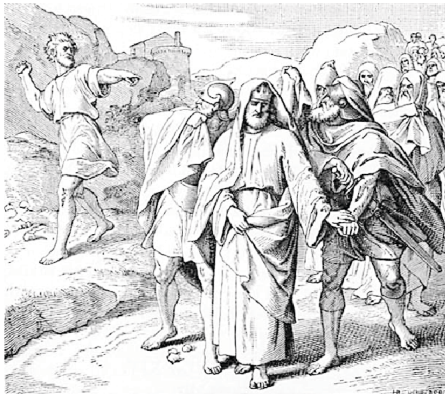
ଶିମିୟ ଦାଉଦଙ୍କୁ ଅଭିଶାପ ଦେଉଛି ।

୨ ଶାମୁୟେଲ ୧୬ରେ, ଆମେ ଜଣେ ବୃଦ୍ଧ, ପରିପକ୍ୱ, କ୍ଳାନ୍ତ ଶ୍ରୀକ୍ତ ଦାଉଦଙ୍କୁ ଦେଖୁ । ସେ ବର୍ତ୍ତମାନ ନିଜର ପୁତ୍ର ଅବଶାଲୋମୀଠାରୁ ପଳାୟନ କରୁଥିଲେ କାରଣ ସେ ତାଙ୍କ ରାଜ୍ୟ ଅଧିକାର କରି ନେଇଥିଲା । ଏପରି ଏକ ସମୟରେ ଯେତେବେଳେ ସେ ବିଶ୍ରାମ ନେଇ ନିଜ ସନ୍ତାନମାନଙ୍କ ଉପରେ ନିର୍ଭର କରିପାରିବେ ବୋଲି ଭାବିଥିଲେ, ସେତେବେଳେ ତାଙ୍କୁ ନିଜ ଜୀବନ ବଞ୍ଚାଇବା ପାଇଁ ଦୌଡ଼ିବାକୁ ପଡ଼ିଥିଲା । ଦାଉଦ ଶାରୀରିକ, ମାନସିକ ଓ ଆବେଗିକ ଭାବରେ କ୍ଳାନ୍ତ ଶ୍ରୀକ୍ତ ହୋଇ ଯାଇଥିଲେ । ଏହି ସମୟରେ, ସେ ଶାଉଳଙ୍କ ପରିବାରର ଜଣେ ସଦସ୍ୟ ଶିମିୟ ଅତି ଖରାପ ଭାଷାରେ ଦାଉଦଙ୍କ ପ୍ରତି ଭର୍ଷନା ଓ ନିନ୍ଦା କରିବାକୁ ଲାଗିଲା - “... ଆରେ ରକ୍ତପାତୀ ମନୁଷ୍ୟ, ଆରେ ପାପାଧମ ଲୋକ ଦୂରଳ ଦୂର । ଯାହାର ପଦରେ ତୁ ରାଜ୍ୟ କରୁଥିଲୁ ସେହି ଶାଉଳ ବଂଶର