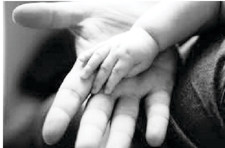
God trains my fingers for battle

ಪೌಲನ ಇನ್ನೊಂದು ಮಾತಿನಲ್ಲಿ ನಂಬಿಕೆ ಯೆಂಬ ಶ್ರೇಷ್ಠ ಹೋರಾಟವನ್ನು ಮಾಡಬೇಕು.