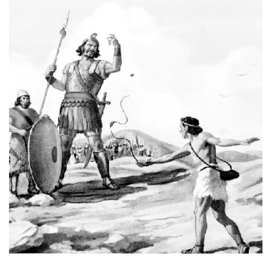
David fought with Goliath

ಪ್ರೀತಿಯ ಸಹೋದರಿ ಮತ್ತು ಸಹೋದರಿಯರೇ, ಯುದ್ಧ ರಣರಂಗಕ್ಕೆ ದಾವಿದನನ್ನು ಕರೆತರುವುದಕ್ಕೆ ದೇವರು ವಿಶೇಷವಾದ ಯೋಜನೆಯನ್ನು ಇಟ್ಟಿದ್ದನು. ದಾವಿದನು ಪ್ರಾರಂಭದಲ್ಲಿ ತಾನು ಕೇವಲ ತನ್ನ ಸಹೋದರಿಗೆ ಆಹಾರವನ್ನು ತಲುಪಿಸುತ್ತಿದ್ದೇನೆ ಎಂದು ನಂಬಿದ್ದನು. ದೇವರು ದೈವತ್ವದ ಯೋಜನೆಯನ್ನು ಹೊಂದಿದ್ದನು. ದಾವಿದನನ್ನು ಇಸ್ರಾಯೇಲ್ಯನ ಅರಸನನ್ನಾಗಿ ಮಾಡುವುದಕ್ಕೆ ಇದು ಮೊದಲ ಹೆಜ್ಜೆಯಾಗಿತ್ತು. ದಾವಿದನಿಗೆ ಆ ಸಮಯದಲ್ಲಿ ಯಾವುದೇ ಸುಳಿವು ಇರಲಿಲ್ಲ. ದೇವರು ಅದ್ವೀತವಾದ ಯೋಜನೆಯನ್ನು ಹೊಂದಿದ್ದನು ಮತ್ತು ಆತನಿಗಾಗಿ ಆಶೀರ್ವಾದದ ಅಂಗಡಿ ಆತನಿಗಾಗಿ ಇತ್ತು.