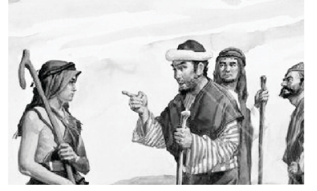
Eliab asked questions to David

ಎಲಿಯಾಬನ ಆರೋಪಗಳನ್ನು ನಾವು ಈಗ ನೋಡೋಣ : ಇಲ್ಲಿಗೆ ಯಾಕೆ ಬಂದಿಯಾ? ಅಡವಿಯಲ್ಲಿರುವ ನಾಲ್ಕಾರು ಕುರಿಗಳನ್ನು ಯಾರಿಗೊಪ್ಪಿಸಿ ಬಂದಿ?