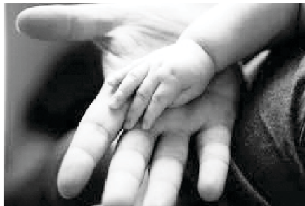
देव माझ्या बोटाना युद्धासाठी प्रशिक्षण देतो

हे थोर किंवा भय्य असे युद्ध आपण कसे सुरु ठेवू शकतो? ते केवळ विश्वासा द्वारे विश्वासाशिवाय हे सुयुद्ध आपण लढू शकत नाही आणि अनंतकालीक जीवन सुरक्षित ठेवू शकत नाही. याचा अर्थ आपण