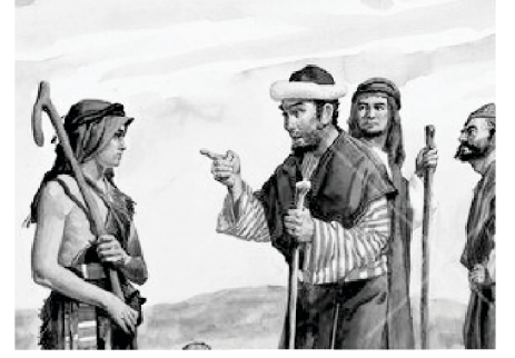
अलीयाबने दाऊदला प्रश्न विचारला

“तुझी घमेंड व तुझा मनाचा उद्यामपणा मी जाणून आहे”