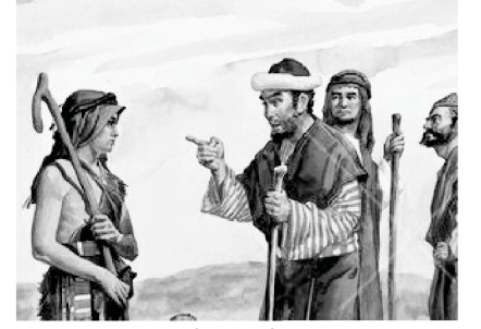
અલીઆબને દાઉદસે પ્રશ્ન પુછા

જો દાઉદે આ સઘળા દોષારોપણોવાળાં પ્રશ્નોનાં જવાબો આપવાનું શરૂ કર્યું હોત, તો તે ગોલ્યાથને બદલે અલીઆબ સાથે લડતો રહ્યો હોત. તેના લડાઈનાં મેદાનમાં આવવાનો હેતુ પરિપૂર્ણ થયો નહોત. જો ઈશ્વર તમને ગોલ્યાથની સામે લડવા માટે તેડે છે, તો અલીઆબો સાથે તમારો સમય ન વેડફો. તમારી લડાઈઓની પસંદગી ડલાપણથી કરો, આપણી લડાઈ આ જગતના અલીઆબો સામે લડવા માટે નતી પણ ગોલ્યાથો સામે લડવા માટે છે. દૂર ફરી જવાનું શીખો!!