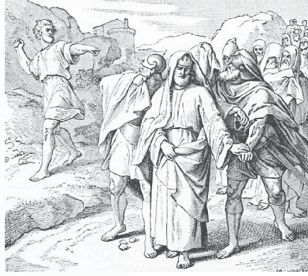
શિમઈએ દાઉદને શાપ આપ્યો

૨ શમુએલ ૧૬માં, આપણે એક વૃદ્ધ, પરીપક્વ, થાકેલા દાઉદને જોઈએ છીએ. હવે તે તેના દીકરા આબ્શાલોમથી નાસતો ફરતો હતો, જેણે તેનું રાજ્ય છીનવી લીધું હતું. તે સમયે જ્યારે તેને લાગતું હતું. હતું કે તે હવે આરામ, વિસામો કરી શકશે અને તેના છોકરાંઓ પર આધાર રાખી શકશે, ત્યારે તેને તેના જીવનને બચાવવા નાસવું પડ્યું હતું! દાઉદ શારીરિક માનસિક અને ભાવનાત્મક રીતે થાકેલો હતો. આ સમયે, તેનો ભેટો શિમઈ સાથે થાય છે, જે શાઉલનો સગો હતો, જેણે તેની તરફ બૂમો પાડતા કઠોર શબ્દો વાપર્યા હતા અને દાઉદને શાપ આપ્યો હતો.