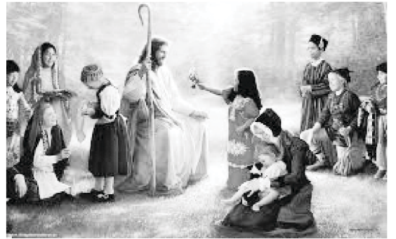
ஆண்டவர் இயேசு கிறிஸ்துவடன் இளம் பிராயத்தினர் மற்றும் குழந்தைகள்

உலகம் முழுவதும் உள்ள இளம் ஆண்கள், பெண்கள் மற்றும் குழந்தைகள் ஆகியோர் நல்வாழ்வுக்காக தேவனிடம் ஒரு நிமிடம் ஜெபிக்கும்படியாக சர்வதேச வாலிபர் மற்றும் சிறுவர் நல தரிசனம் (Global Vision for Youth & Kid Care) என்ற ஒரு அமைப்பை ஏற்படுத்தியுள்ளோம். இதில் உலகளாவிய விதத்தில் ஏராளமான நண்பர்கள் தங்கள் பெயர்களைப் பதிவு செய்துள்ளனர். இவர்கள் தினமும் அவரவர் தேச நேரப்படி இரவு 10 மணிக்கு தங்களது கடமையான கீழ்க்காணும் ஒரு நிமிட ஜெபத்தை ஏறெடுக்கிறார்கள். அதாவது,