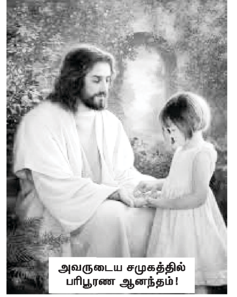
அவருடைய சமூகத்தில் பரிபூரண ஆனந்தம்!

இயேசு பரலோகம் செல்லும் முன்பதாக இவ்வாறு கூறினார்: ... அப்பொழுது என்றென்றைக்கும் உங்களுடனே கூட இருக்கும்படிக்குச் சத்திய