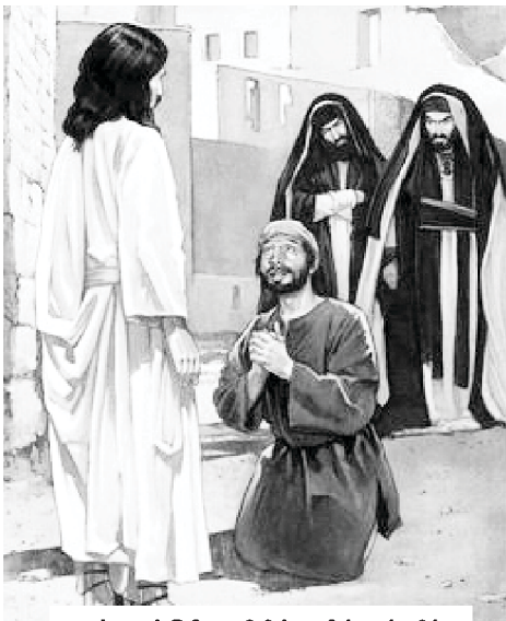
ஆண்டவர் இயேசு கிறிஸ்துவின் மன்னிப்பு!

- எஸ். சாம் செவ்வராஜ், ஆசிரியர் +91-98412 71858