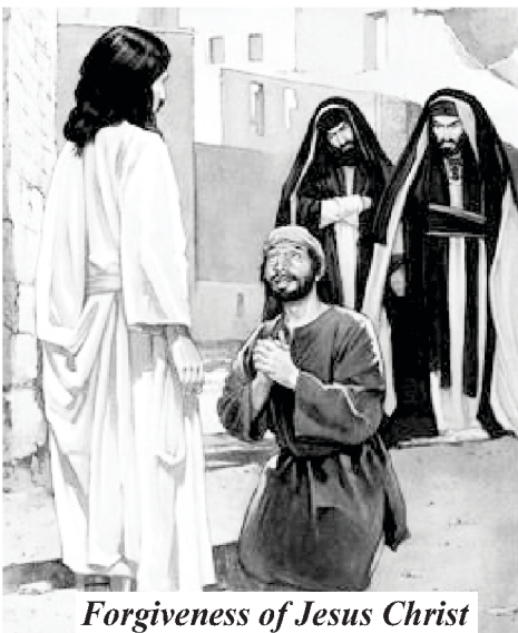
Forgiveness of Jesus Christ

अंततः, जब परमेश्वर ने संसार को बनाया, तो उसने देखा कि यह अच्छा, सुंदर और उत्तम था। हालांकि, आज्ञा न मानने के कारण पाप का प्रवेश हुआ और उसके साथ सब कुछ बदल गया।