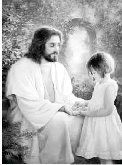
তাঁর উপস্থিতির মধ্যে আনন্দের পূর্ণতা আছে

ঈশ্বরের তৃতীয় উপহার হচ্ছে তাঁর উপস্থিতি। বাঃ! কি চমৎকার উপহার! তাঁর নাম ইমানুয়েল, যার অর্থ “আমাদের সহিত ঈশ্বর।” তিনি আমাদের কাছে প্রতিজ্ঞা করেছেন যে তিনি আমাদের কখনও ছাড়বেন না, কখনও পরিত্যাগ করবেন না। তাঁর উপস্থিতির মধ্যে, আনন্দের