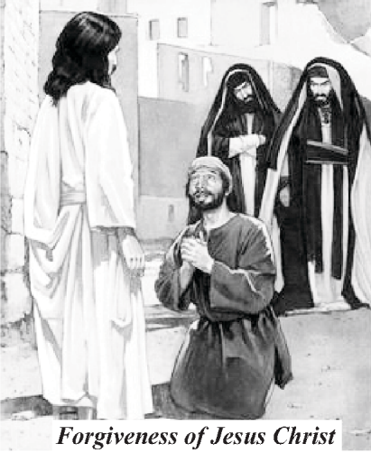
Forgiveness of Jesus Christ

অবশেষে, ঈশ্বর যখন এই জগৎ সৃষ্টি করেছিলেন, তিনি দেখেছিলেন এটি উত্তম, সুন্দর, এবং নিখুঁত ছিল। যাইহোক, অবাধ্যতার মাধ্যমে পাপের প্রবেশের সঙ্গে সঙ্গে প্রত্যেকটি বিষয় পরিবর্তিত হয়েছিল।