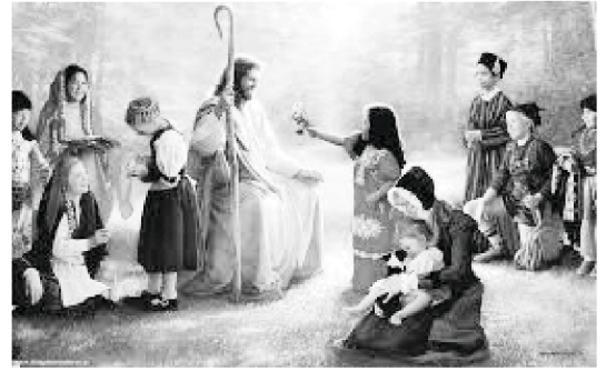
ইয়ুথ এবং বাচ্চাদের সঙ্গে প্রভু যীশু খ্রীষ্ট

আপনি যদি আপনার সন্তানদের নাম দেন, তাহলে আমরা প্রার্থনার জন্য তাদের নাম অন্তর্ভুক্ত করবো। অনুগ্রহ করে এই উদ্দেশ্যের জন্য কোনও আর্থিক অনুদান পাঠানো থেকে বিরত থাকুন।