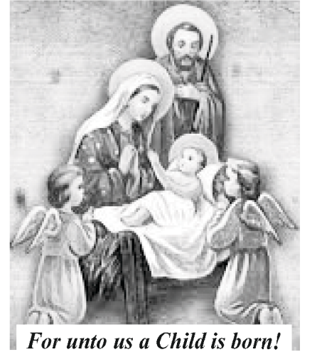
For unto us a Child is born!

বীশু খ্রীষ্টের জন্ম আমাদের স্মরণ করিয়ে দেয় যে আমাদের ঈশ্বর প্রতিজ্ঞা রক্ষাকারী। তিনি যা বলেন, তিনি তা করবেন। তিনি মিথ্যা কথা বলার অথবা তাঁর মন পরিবর্তন করার মানুষ নন। এমনকী এর জন্য সময় লাগতে পারে-কয়েক সময় কয়েকটি প্রজন্ম সময় লাগতে পারে - কিন্তু তাঁর প্রতিজ্ঞা সর্বদা স্থির থাকে। বাইবেল বলে, “আকাশের ও পৃথিবীর লোপ হইবে, কিন্তু আমার বাক্যের লোপ কখনও হইবে না” (মথি ২৪:৩৫)।