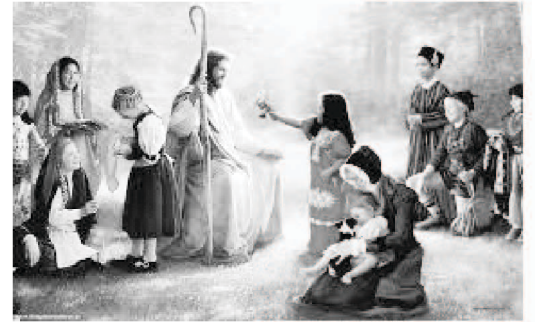
પ્રભુ ઈસુ ખ્રિસ્ત સાથે જુવાનો અને બાળકો

અમારા ઘણા સર્મ્પિત સાથીઓ જેઓ અમારી મિનિસ્ટ્રીમાં આગળ પડતી સેવા આપી રહ્યા છે, તેઓ વિવિધ માંદગીઓ સાથે જકડાયેલા છે અને ઘણું નોંધપાત્ર નુકસાન વેદી રહ્યા છે.