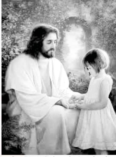
તેમની હાજરીમાં આનંદની પૂર્ણતા છે

છે તેમની હાજરી. આહા! કેવી અદ્ભુત ભેટ! તેમનું નામ છે ઈમ્માનુએલ, એટલે, “ઈશ્વર આપણી સાથે છે”. તેમણે આપણને ખાતરી દાયક વચન આપ્યું છે કે તેઓ આપણને છોડી દેશે નહિ કે તજ દેશે નહિ. તેમની હાજરીમાં, ત્યાં સંપૂર્ણ આનંદ છે. (ગીતશાસ્ત્ર ૧૬:૧૧) દાઉદ રાજા પાસે તેના જીવનમાં બધું જ હતું - પૈસા, ખ્યાતિ, સંપત્તિ, સત્તા, વિજય અને તોપણ તેણે તે સર્વના કરતા એક બાબતની ઝંખના રાખી હતી - ઈશ્વરની સંમુખ, હજૂરમાં રહેવાની, તેના મહેલમાં રહેવા કરતા વધુ. જ્યારે દાઉદે પાપ કર્યું હતું, ત્યારે તે તેની પ્રતિષ્ઠાથી ચિંતિત ન હતો; તે પવિત્ર આત્માની હાજરી માટે વધુ ચિંતિત હતો. તેણે કહ્યું, “તારી સંમુખથી મને કાઢી મૂકતો નહિ; અને તારો પવિત્ર આત્મા મારી પાસેથી લઈ લેતો નહિ.” (ગીતશાસ્ત્ર ૫૧:૧૧).