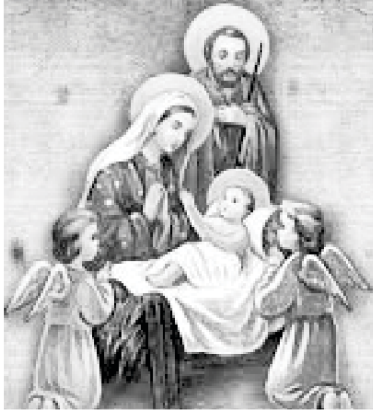
For unto us a Child is born!

آسمان اور زمین ٹل جائیں گے، لیکن میرے الفاظ کبھی نہیں ٹلیں گے متی ۲۴: ۳۵ (این آئی وی)۔ تاہم، ہم اکثر چند ہفتوں، مہینوں یا سالوں کے بعد آسانی سے بارمان لیتے ہیں۔ ایک بات ہمیں یاد رکھنے کی ضرورت ہے کہ جب خدا کچھ کہتا ہے تو وہ کرے گا۔ یہ ہماری زندگی کے دوران یا ہمارے بچوں کے وقت میں بھی ہو سکتا ہے۔ خدائے ہمدانی لوگوں سے ایک مسیحا کا وعدہ کیا، اور اس نے ایک کو بھیجا!