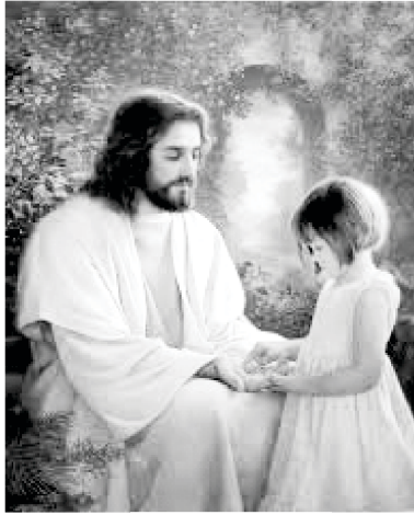
اس کی حضوری میں خوشی کی معموری ہے

اُس کی موجودگی میں، خوشی کی معمور ہے! خدا کی طرف سے تیسرا تجربہ اس کی موجودگی ہے۔ واہ! کیا حیرت انگیز تجربہ ہے! اس کا نام ایمانوئل ہے، جس کا مطلب ہے "خدا ہمارے ساتھ ہے۔" اُس نے وعدہ کیا ہے کہ وہ ہمیں بھی نہیں چھوڑے گا اور نہ ہی ہمیں ترک کریگا۔ اس کی موجودگی میں،