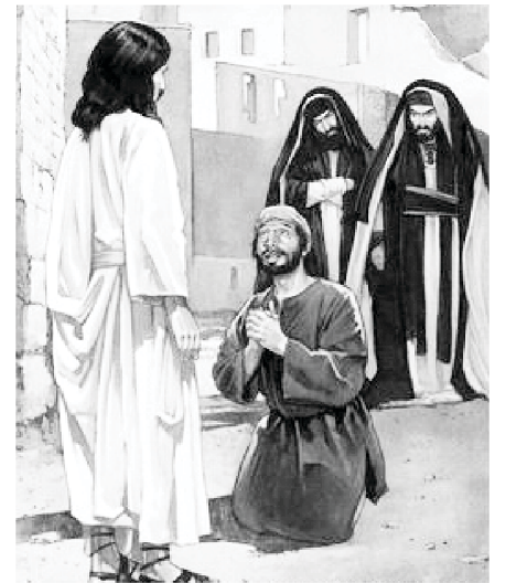
Forgiveness of Jesus Christ