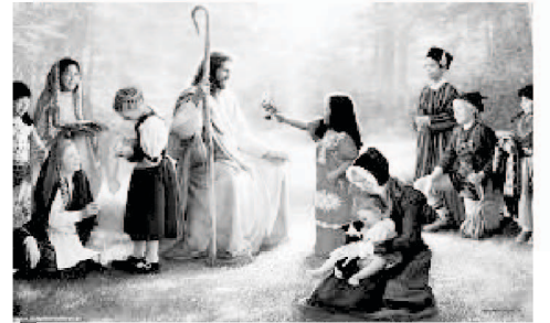
Youth and Kids with Lord Jesus Christ!

ہم نے گلوبل ڈن فارلوتھ اینڈ کڈز کے نام سے ایک تحریک شروع کی ہے جس کا مقصد دنیا بھر میں نو جوان لڑکوں، لڑکیوں اور بچوں کی فلاح و بہبود کے لیے ایک منٹ کے لیے دعا کرنا ہے۔ دنیا بھر سے بہت سے دوستوں نے اس خدمات میں اپنے نام درج کرائے ہیں۔ ہر وہ شخص جس نے رجسٹریشن کرائی ہے اس کی حوصلہ افزائی کی جاتی ہے کہ وہ ہر رات مانے، جس ملک میں وہ رہتے ہیں اس کے مطابق درج ذیل دعا پڑھیں: