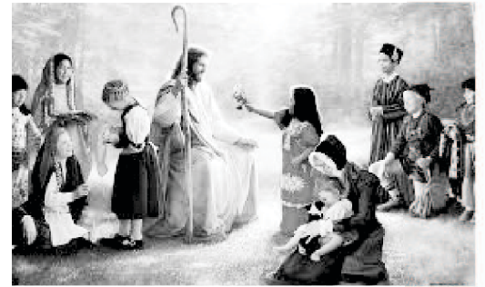
Youth and Kids with Lord Jesus Christ!

हाम्रो सेवकाइको अधिल्लो पङ्क्तिमा रहेर सेवा गर्ने हामी धेरै समर्पित सहकर्मीहरू विभिन्न प्रकारका रोगसँग लडिरहनुभएको छ र महत्वपूर्ण नोक्सानी सहनुभएको छ। हामी सम्पूर्ण परमेश्वरका