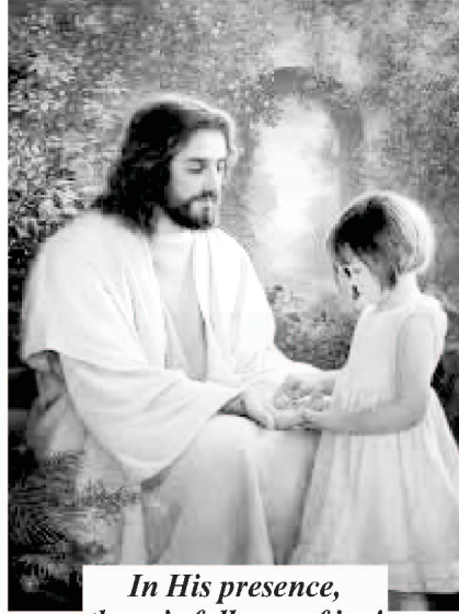
In His presence, there is fullness of joy!

परमेश्वरबाट आएको तेस्रो उपहार उहाँको उपस्थिति हो। वाह ! कस्तो अचम्मको उपहार ! उहाँको नाउँ इम्मानुएल हो, जसको अर्थ