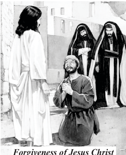
Forgiveness of Jesus Christ

अन्त्यमा, जब परमेश्वरले संसारलाई सृष्टि गर्नुभयो, उहाले त्यो असल, सुन्दर र सिद्ध