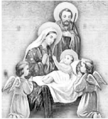
For unto us a Child is born!