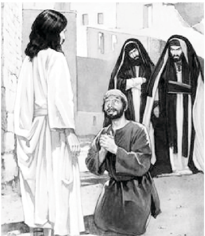
Forgiveness of Jesus Christ

ଏହା ପାପକୁ ଜନ୍ମ ଦେଇଥିଲା ଓ ସେହିଦିନଠାରୁ ମନୁଷ୍ୟ ଜାତି ପାପକୁ ଓ ଏହାର ପରିଣାମକୁ ଅତିକ୍ରମ କରିବା ପାଇଁ ସଂଘର୍ଷ କରି ଆସୁଅଛି । ଏହା ଏପରି