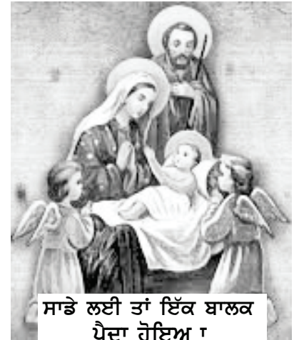
ਸਾਡੇ ਲਈ ਤਾਂ ਇੱਕ ਬਾਲਕ ਪੈਦਾ ਹੋਇਆ।

ਯਿਸੂ ਮਸੀਹ ਦਾ ਜਨਮ ਸਾਨੂੰ ਯਾਦ ਦਿਵਾਉਂਦਾ ਹੈ ਕਿ ਸਾਡਾ ਪ੍ਰਮੇਸ਼ਵਰ ਵਾਅਦਾ ਕਰਨ ਵਾਲਾ ਹੈ। ਜੇ ਉਹ ਕਹਿੰਦਾ ਹੈ, ਉਹ ਪੂਰਾ ਵੀ ਕਰਦਾ ਹੈ। ਉਹ ਝੂਠ ਬੋਲਣ ਜਾਂ ਆਪਣਾ ਮਨ ਬਦਲਣ ਵਾਲਾ ਨਹੀਂ ਹੈ। ਭਾਵੇਂ ਸਮਾਂ ਵੀ ਲੱਗ ਜਾਵੇ - ਕੁਝ ਪੀੜ੍ਹੀਆਂ ਵੀ ਲੰਘ ਜਾਣ - ਪਰ ਉਸਦਾ ਵਾਅਦਾ ਹਮੇਸ਼ਾ ਕਾਇਮ ਰਹਿੰਦਾ ਹੈ। ਬਾਈਬਲ ਕਹਿੰਦੀ ਹੈ, ਸਵਰਗ ਅਤੇ ਧਰਤੀ ਟਲ ਜਾਣਗੇ, ਪਰ ਮੇਰੇ ਸ਼ਬਦ ਕਦੇ ਨਹੀਂ ਟਲਣਗੇ (ਮੱਤੀ 24:35)।