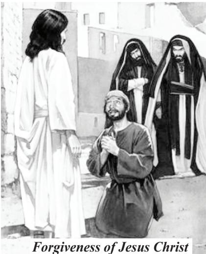
Forgiveness of Jesus Christ

ਅੰਤ ਵਿੱਚ, ਜਦੋਂ ਪ੍ਰਮੇਸ਼ਵਰ ਨੇ ਸੰਸਾਰ ਨੂੰ ਬਣਾਇਆ, ਉਸਨੇ ਦੇਖਿਆ ਕਿ ਇਹ ਵਧੀਆ, ਸੁੰਦਰ ਅਤੇ ਸੰਪੂਰਨ ਸੀ। ਹਾਲਾਂਕਿ, ਅਣਆਗਿਆਕਾਰੀ ਦੁਆਰਾ ਪਾਪ ਦੇ ਪ੍ਰਵੇਸ਼ ਨਾਲ, ਸਭ ਕੁਝ ਬਦਲ ਗਿਆ।