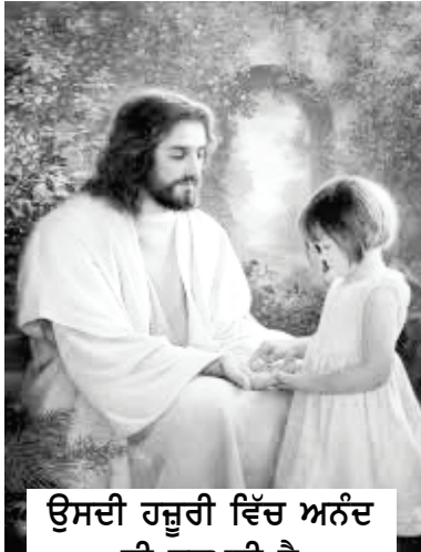
ਉਸਦੀ ਹਜ਼ੂਰੀ ਵਿੱਚ ਅਨੰਦ ਦੀ ਭਰਪੂਰੀ ਹੈ

ਪ੍ਰਮੇਸ਼ਵਰ ਦੀ ਤੀਜੀ ਦਾਤ ਉਸਦੀ ਮੌਜੂਦਗੀ ਹੈ। ਵਾਹ! ਕਿੰਨਾ ਸ਼ਾਨਦਾਰ ਤੋਹਫ਼ਾ ਹੈ! ਉਸਦਾ ਨਾਮ ਇਮਾਨੂਏਲ ਹੈ, ਜਿਸਦਾ ਅਰਥ ਹੈ "ਪਰਮੇਸ਼ੁਰ ਸਾਡੇ ਨਾਲ ਹੈ।" ਉਸਨੇ ਵਾਅਦਾ ਕੀਤਾ ਹੈ ਕਿ ਉਹ ਸਾਨੂੰ ਕਦੇ ਨਹੀਂ ਛੱਡੇਗਾ ਅਤੇ ਨਾ ਹੀ ਸਾਨੂੰ ਤਿਆਗੇਗਾ। ਉਸਦੀ ਹਜ਼ੂਰੀ ਵਿੱਚ, ਅਨੰਦ ਦੀ ਭਰਪੂਰੀ ਹੈ (ਜ਼ਬੂਰ 16:11)। ਰਾਜਾ ਦਾਊਦ ਕੋਲ ਜੀਵਨ ਵਿੱਚ ਸਭ ਕੁਝ ਸੀ - ਪੈਸਾ, ਪ੍ਰਸਿੱਧੀ, ਦੌਲਤ, ਸ਼ਕਤੀ, ਜਿੱਤ, ਪਰੰਤੂ ਇੱਕ ਚੀਜ਼ ਸੀ ਜੋ ਉਹ ਸਭ ਤੋਂ ਵੱਧ ਚਾਹੁੰਦਾ ਸੀ - ਪ੍ਰਭੂ ਦੀ ਹਜ਼ੂਰੀ ਵਿੱਚ ਹੋਣਾ। ਜਦੋਂ ਦਾਊਦ ਨੇ ਪਾਪ ਕੀਤਾ, ਤਾਂ ਉਹ ਆਪਣੀ ਨੇਕਨਾਮੀ ਬਾਰੇ ਚਿੰਤਤ ਨਹੀਂ ਸੀ; ਉਹ ਪਵਿੱਤਰ ਆਤਮਾ ਦੀ ਮੌਜੂਦਗੀ ਬਾਰੇ ਵਧੇਰੇ ਚਿੰਤਤ ਸੀ। ਉਸ ਨੇ ਆਖਿਆ, ਮੈਨੂੰ ਆਪਣੀ ਹਜ਼ੂਰੀ ਤੋਂ ਦੂਰ ਨਾ ਕਰਨਾ। ਹੇ ਪ੍ਰਭੂ, ਮੇਰੇ ਤੋਂ ਆਪਣਾ ਪਵਿੱਤਰ ਆਤਮਾ ਨਾ ਲਓ (ਜ਼ਬੂਰ 51:11)। ਜਦੋਂ ਯਿਸੂ ਸਵਰਗ ਗਿਆ, ਉਸਨੇ ਕਿਹਾ, “ਮੈਂ ਤੁਹਾਡੇ ਲਈ ਇੱਕ ਸਹਾਇਕ ਭੇਜਾਂਗਾ। ਉਹ ਤੁਹਾਡੀ ਅਗਵਾਈ ਕਰੇਗਾ। ਉਹ ਹਰ ਵੇਲੇ ਤੁਹਾਡੇ ਨਾਲ ਰਹੇਗਾ” (ਯੂਹੰਨਾ 14:16)। ਆਓ ਅੱਜ ਆਪਣੇ ਆਪ ਤੋਂ ਪੁੱਛੀਏ, ਕੀ ਸਾਡੇ ਜੀਵਨ ਵਿੱਚ, ਸਾਡੇ ਪਰਿਵਾਰਾਂ ਵਿੱਚ, ਸਾਡੇ ਘਰਾਂ ਵਿੱਚ, ਅਤੇ ਪਤੀ-ਪਤਨੀ ਦੇ ਰਿਸ਼ਤੇ ਵਿੱਚ ਰੱਬ ਦੀ ਮੌਜੂਦਗੀ ਦਾ ਤੋਹਫ਼ਾ ਹੈ? ਕੀ ਅਸੀਂ