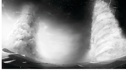
மேக மற்றும் அக்னி ஸ்தம்பமாய் நிற்கும் கர்த்தர்!

எகிப்தை விட்டு இஸ்ரவேலர் வெளியே வந்தபோது இவ்வாறான அனுபவத்தை அவர்கள் பெற்றனர். 430 வருடங்களாகக் கர்த்தரை நோக்கி அவர்கள் கூப்பிட்ட பின், ... கர்த்தர் பகலில் அவர்களை