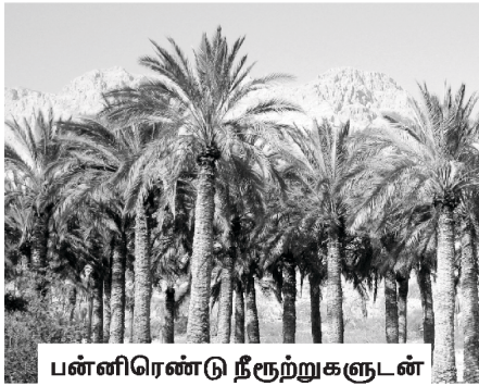
பன்னிரண்டு நீருற்றுகளுடன் கூடிய பேரிச்சமரங்கள்

அவர்களுக்காக, ஒரு ஊற்று அல்ல, 12 ஊற்றுகளை ஆயத்தம் பண்ணியிருந்தார் (யாத்திராகமம் 15:27). ஒவ்வொரு கோத்திரத்திற்கும் ஒன்று என்று நான்