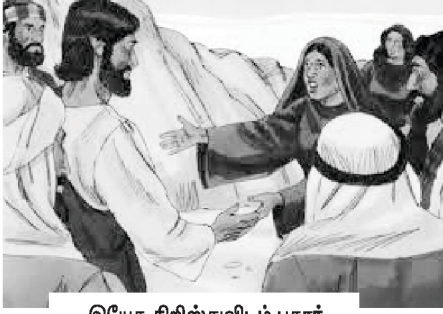
இயேசு கிறிஸ்துவிடம் புகார் செய்யும் மார்த்தாரும், மரியாரும்!

மார்த்தாரும், மரியாரும் இயேசுவிடம் ஒருமுறை இவ்வாறாகப் புகார்