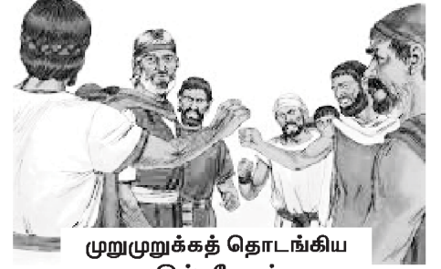
முறுமுறுக்கத் தொடங்கிய இஸ்ரவேலர்

நீங்கள் தேவனிடத்தில் நெருங்கும் போது சாத்தான் சவால்களையும், மாற்றுவழிகளையும் உங்கள் பாதையில் கொண்டு வருவான். மூன்று நாட்கள் குடிக்க தண்ணீர் கிடைக்காமல் வனாந்தரத்தில் இஸ்ரவேலர் நடந்தார்கள் (யாத்திராகமம் 15:22). அவர்கள் முறுமுறுக்கத் தொடங்கினார்கள். அடிமைத் தனம், சாபம் போன்றவற்றிலிருந்து தேவன் அவர்களை வெளியே வரச்செய்து விடுதலை கொடுத்த அவரது நன்மைகளை அவர்கள்