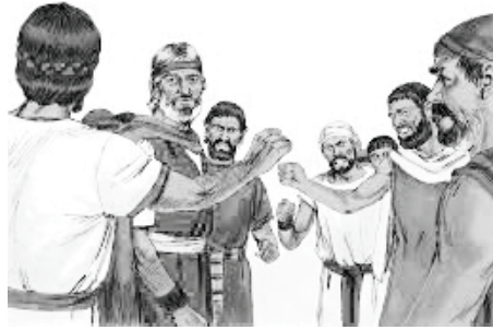
Hulle het begin kla

Onthou, soos jy nader aan God kom, sal die satan uitdagings en wegleidings op jou pad bring. Hulle het onder druk geraak toe