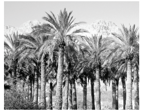
Twaalf fonteine en sewentig palmbome

Maar God se weë is hoër en groter as ons gedagtes. Ten spyte van hul klagtes het God vir hulle nie net een fontein gegee nie, maar twaalf (Eksodus 15:27). Seker een vir elke stam. Hy het voorsien dat hulle dalk kon begin stry daarvoor en voorsien toe oorvloedig sodat hulle daar by die water kon kampeer.