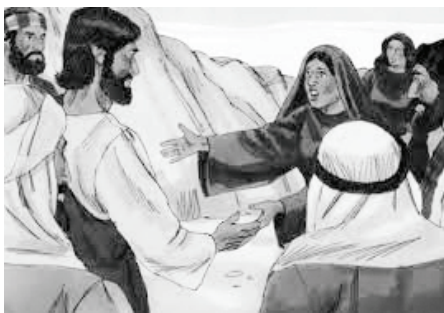
Marta and Maria kla by Jesus Christus!

'n Voorbeeld hiervan is te sien in Marta en Maria se klagte teenoor Jesus: "Here, as U hier was, sou my broer nie gesterwe