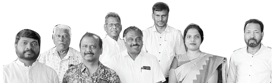
Nehemiah Bybelkollege Sleutel Leiers

Nehemia Bybelkollege waar klasse tans aangebied word in Tamil en Hindi. Ons beoog om in die nuwe jaar die kollege uit te brei en Engels in te sluit. En ons noem met groot opgewondenheid dat ons in die laaste fase is om akkreditasie te kry van die hoog geagte akkreditasie organisasie Asia Theological Association. Ons het reeds geregistreerde lidmaatskap vir