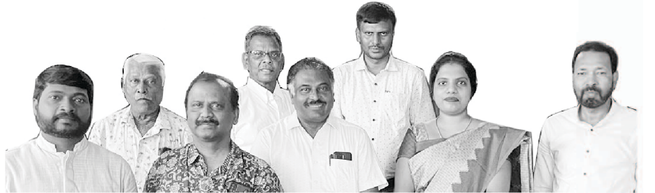
नहेम्या वायबल कॉलेजचे पुढारी

आणि हिन्दी भाषेत वर्ग घेतले जात आहेत. या नवीन वर्षात आम्ही इंग्रजी भाषा समाविष्ट करण्याचे योजित आहोत. आम्ही प्रशासनीय अशी अधिकृत संस्था-एशिया थियॉलॉजीकल असोशीएशन कडून अधिकृत मान्यता प्राप्त करण्याच्या शेवटच्या टप्प्यात आहोत, हे जाहिर करण्यास आम्हांस अत्यंत आनंद होत आहे. आम्हाला त्यांच्याकडून अधिकृत नोंदणी