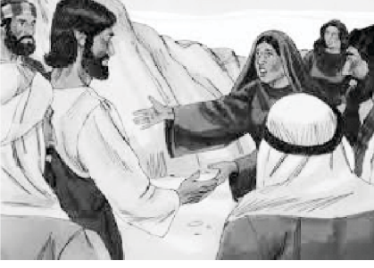
मार्था आणि मरीया यांनी येशू ख्रिस्तला तक्रार केली

वेळा देव आपल्याला जीवनात काही गमावल्याचा अनुभव येऊ देतो. आपल्या प्रिय जनांना गमावल्याचा आपणा पैकी काही जण मागील वर्षात या अनुभवातून गेले असणार आणि तो विश्वास ठेवण्यास कठीण असा नाऊमेद/उत्साहभंग असा असणार. आपण प्रश्न करितो, देवाने कां हस्तक्षेप केला नाही, आपल्या प्रार्थनांना कां उत्तर दिले नाही. तथापी बायबल योहान ११:३५ वचनात आठवण करून देत आहे. "येशू रडला." आपल्याला ज्याला आपले दुःख वेदना, अश्रु आणि भग्नपणा समजतो असा महायाजक आहे. "कारण ज्याला आपल्या अशक्तपणाचे दुःख होत नाही, असा आपला प्रमुख याजक नाही, तर तो सर्व प्रकारे आपल्याप्रमाणे पारखलेला होता; तरी निष्पाप राहिला." (इब्री ४:१५)