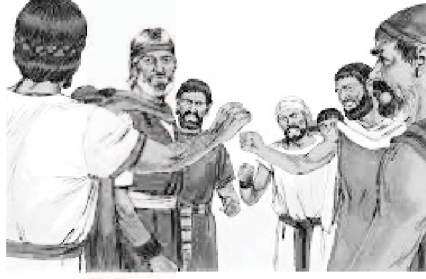
कुरकुर करू लागले

जवळ येता, सैतान तुमच्या मार्गात आवाहाने आणि मार्गात वळणे आणेल. इस्त्राएल लोकांना तीन दिवस पिण्यास पाणी मिळाले नाही तेव्हा त्यांना त्या आवाहानाला सामोरे जावे लागले. (निर्गम १५:२२) आणि ते तक्रार करू लागले. देवाने त्यांना त्याच्या दास्यातून, शापातून, बंधनातून सोडविले व स्वतंत्रता दिली या त्याच्या चांगुलपणा ते विसरले. दुर्दैवाने असे आहे आपली स्मरणशक्ति कमी असल्यामुळे आपल्याला देवाचा चांगुलपणा लक्षात रहात नाही.