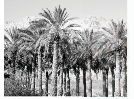
सत्तर तळवे असलेल्या बारा विहिरी

ते कुरकुर करू लागले. (निर्गम १५:२४) देवाचे चांगुलपणा विसरून