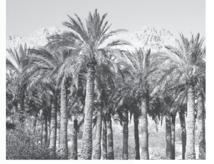
બાર ઝરા તથા સિત્તેર ખજૂરીઓ

યાદ રાખો, જ્યારે તમે ઈશ્વરની નજીક જાઓ છો, ત્યારે શેતાન તમારા માર્ગોમાં પડકારો અને ફાંટા લાવશે. તેઓએ પડકારનો સામનો કર્યો હતો જ્યારે તેમને અરણ્યમાં ત્રણ દિવસ સુધી પીવા માટે પાણી મળ્યું નહતું. (નિર્ગમન ૧૫:૨૨) અને તેઓએ કચકચ કરવાનું શરૂ કર્યું હતું. જે ભલાઈ કૃપાથી ઈશ્વર તેમને બંધનમાંથી, શાપ અને ગુલામીમાંથી બહાર કાઢી લાવ્યા હતા, સ્વતંત્રતા આપતા, તે તેઓ ભૂલી ગયા હતા. તે કમનસીબી છે કે આપણે