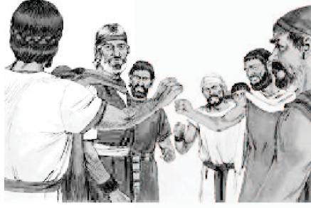
તેઓએ કચકચ કરવાનું શરૂ કર્યું

પછી, તેમણે તેઓને દિવસે તેઓને માર્ગ દેખાડવા સારું મેઘસ્તંભમાં અને રાત્રે તેમને અજવાળું આપવાને અગ્નિસ્તંભમાં દોર્યા હતા. (નિર્ગમન ૧૩:૨૧). તેઓ આનંદથી ભરપૂર થઈ ગયા હતા અને એક આખો અધ્યાય (અધ્યાય ૧૫) તેમના