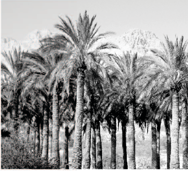
۷۰ کھجوروں کے ساتھ ۱۳ کنویں