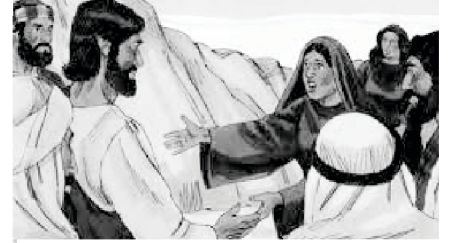
Martha and Mary complained to Jesus Christ!

We need well qualified, experienced, dedicated, hard working and mission oriented Christian. Apply with Bio-data to E.mail: sam@echoofhiscall.org WhatsApp: (+91) 98412 71858