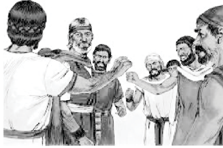
انہوں نے شکایت کرنا شروع کر دی

لیکن خدا کی راہیں ہمارے خیالات سے بلند اور عظیم ہیں۔ ان کی شکایات کے باوجود خدا نے بنی اسرائیل کے لیے نہ صرف ایک کنواں، بلکہ بارہ کنویں تیار کیے تھے (خروج: ۱۵: ۲۷)، میرے خیال میں ہر قبیلے کے لیے ایک۔ خدا نے ان کے درمیان جھگڑے کے امکان کو بٹلے سے ہی دیکھا اور کثرت سے مہیا کیا تاکہ وہ وہاں پانی کے کنارے ڈیرے ڈال سکیں۔