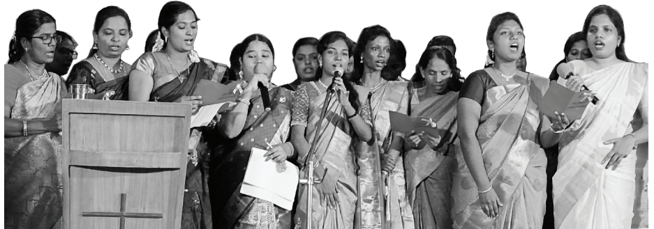
St. Paul's Matriculation School Teachers

We should expound and teach the contemporary generation the undiluted teachings of the ancient and early Apostles. It is the need of the hour.