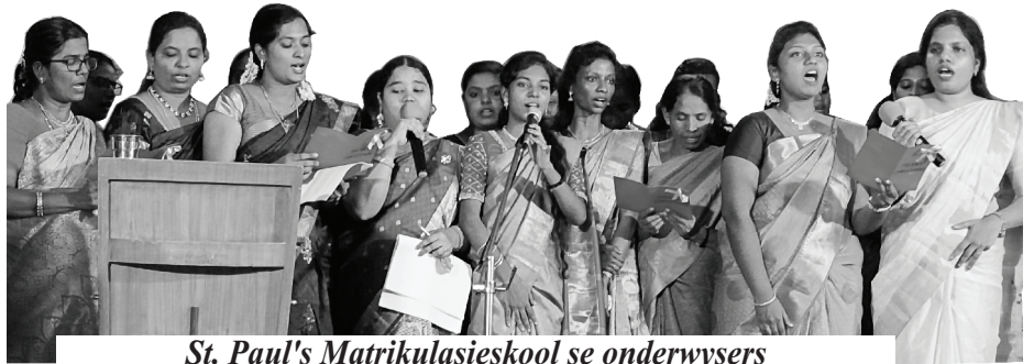
St. Paul's Matrikulasieskool se onderwysers

In die lig van die onlangse feesseisoen (Kersfees, nuwe jaar en Sondagskool se jaarlikse dagprogramme), het ons Evangeliese uitreikbyeenkomste gereël op verskeie plekke in en rondom Santhoshapuram, Balaji Nagar, Velachery en ander plekke. Die terugvoer was baie bemoedigend, want God se teenwoordigheid het mense se harte geraak. Ons versoek nederig julle volgehoue gebede vir ons komende programme vir die nuwe jaar.