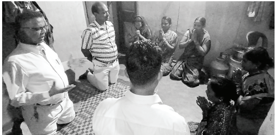
Senior Pastoor se Veldbediening in dorpe

In die lig van die onlangse feesseisoen (Kersfees, nuwe jaar en Sondagskool se jaarlikse dagprogramme), het ons Evangeliese uitreikbyeenkomste gereël op verskeie plekke in en rondom Santhoshapuram, Balaji Nagar, Velachery en ander plekke. Die terugvoer was baie bemoedigend, want God se teenwoordigheid het mense se harte geraak. Ons versoek nederig julle volgehoue gebede vir ons komende programme vir die nuwe jaar.