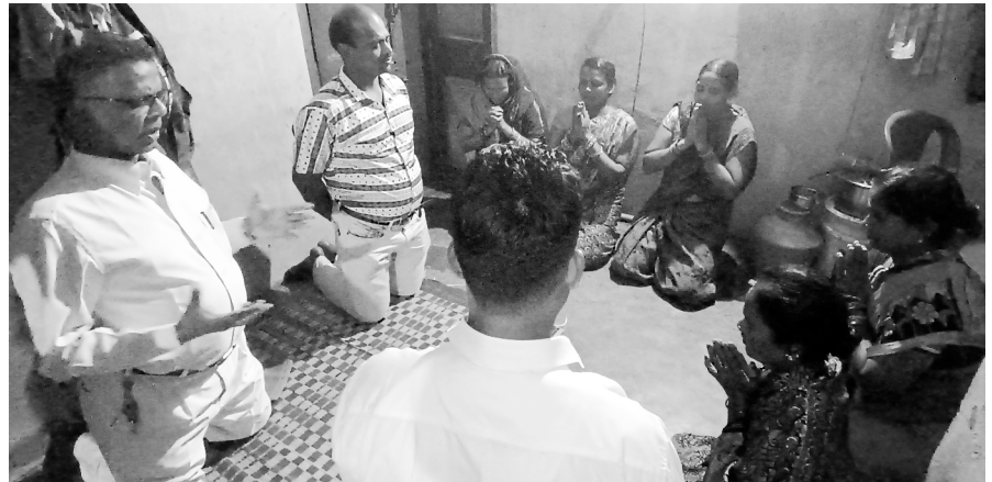
Senior Pastor's Field Ministry in villages

हालैको पर्वको मौसमको सन्दर्भमा (ख्रीष्टमस, नयाँ वर्ष र आइतवार स्कुलको वार्षिक कार्यक्रमहरू) हामीले सान्धोसापुरम, बालाजी नगर, भेलाचेरी र अन्य स्थानहरूका वरिपरि र विभिन्न स्थानहरूमा सुसमाचारीय आउटरीच बैठकहरू आयोजना गरियो थियो । प्रतिक्रिया वास्तवमै उत्साहजनक थियो किनकि परमेश्वरको