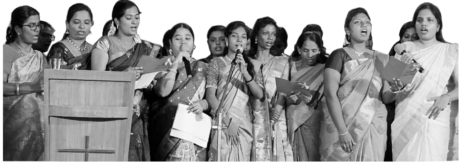
St. Paul's Matriculation School Teachers

बोलावटको प्रतिध्वनिको विविध क्रियाकलापहरूका निम्ति तपाईंको अविरल प्रार्थना र सहायताको निम्ति हामी तपाईंप्रति हाम्रो हार्दिक कृतज्ञता प्रकट गर्दछौं । तपाईंको समर्पणतालाई परमेश्वरले निश्चय नै इनाम दिनुहुनेछ ।