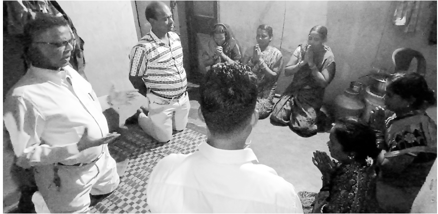
ବଡ଼ଦିନ ସମୟରେ ଆମ ବରିଷ୍ଠ ପାଳକଙ୍କର କ୍ଷେତ୍ର-ସେବାକାର୍ଯ୍ୟ

Our Ministries: ✨ ECHO OF HIS CALL Monthly Magazines (16 languages) ✨ BIBLECOR - Postal Courses (3 languages) ✨ YouTube Ministry ✨ Online Courses ✨ Theological Correspondence Courses (2 languages) ✨ Church Planting ✨ Nehemiah Bible Colleges ✨ Gospel Printing Press ✨ Great Commission Partners ✨ St. Paul's Matriculation School ✨ Crusades ✨ Community Development