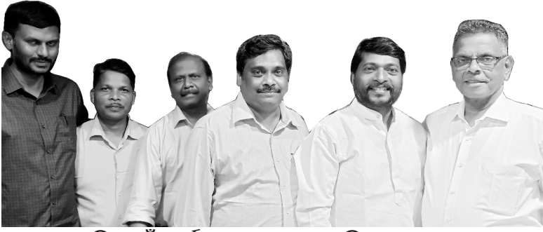
ସ୍ୱାକୃତି ପାଇଁ କାର୍ଯ୍ୟ କରୁଥିବା ଦଳ ସହିତ ଆମର ପାଞ୍ଚର

ଆମେ ଆନନ୍ଦର ସହିତ ଆପଣମାନଙ୍କୁ ଜଣାଇଅଛୁ ଯେ ଆମର ନିହିନିୟା ବାଇବଲ କଲେଜ ପାଇଁ ଏସିଆ ଥିଓଲୋଜିକାଲ ଆସୋସିଏସନ୍ (ATA) ଠାରୁ ସ୍ୱାକୃତି ପାଇବାର ପ୍ରକ୍ରିୟା ଚାଲୁ ରହିଅଛି । ଏହି ପ୍ରକ୍ରିୟାର ସଫଳ ସମାପ୍ତି ନିମନ୍ତେ ଆପଣମାନଙ୍କର ପ୍ରାର୍ଥନାକୁ ବହୁଳ ଭାବରେ ଆଶା କରାଯାଉଅଛି । ଏହା ସହିତ, ଆମେ ନିହିନିୟା ବାଇବଲ କଲେଜର ଲାଇବ୍ରେରୀ ପାଇଁ ହିନ୍ଦୀ ଭାଷାରେ ଥିଓଲୋଜିକାଲ ପୁସ୍ତକ ଆବଶ୍ୟକ କରୁଅଛୁ । ଯଦି ଆପଣମାନଙ୍କ