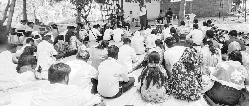
மகாபலிபுரத்தில் ஒருநாள் தியானமுகாம்

மேலும் நம் தலைமை சபை ஊழியங்களில் முன்னணியில் நின்று செயல்படும் நம் உடன் ஊழியர்களுக்காக ஜெபியுங்கள்.