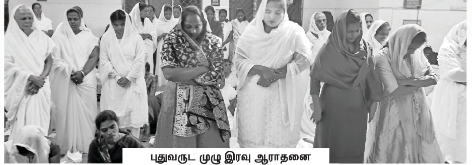
புதுவருட முழு இரவு ஆராதனை

கடந்த நாட்களில் கர்த்தர் நம் ஊழியங்களை அதிசயமாக நடத்தினார். நம் யூடியூப் செய்திகள் மற்றும் பத்திரிகைகள் மூலம் தொலைதூரத்தில் உள்ள மக்களையும் தேவன் தம்முடைய அன்பின் செய்திகளால் சந்தித்தார். 2023 டிசம்பர் 31-ம் தேதி நடந்த நமது புதுவருட