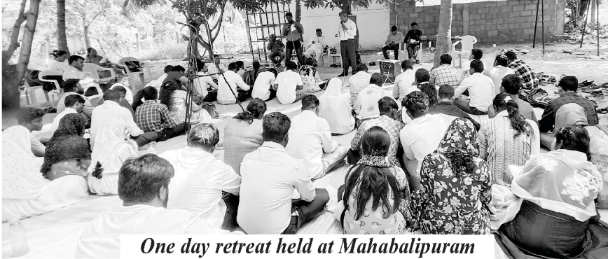
One day retreat held at Mahabalipuram

कृपया प्रभु के हमारे अग्रिम पंक्ति के सहकर्मियों के लिए प्रार्थना करें क्योंकि वे हमारे मुख्य कलीसिया की विविध गतिविधियों में सेवा करते हैं।